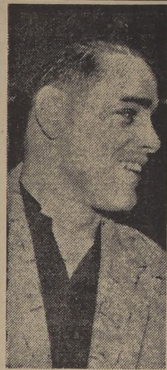
"BOBO" OLSON. — Boxeador norteamericano nacido en las Islas Hawái...