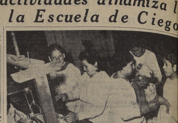
TELARES EN ESCUELA DE CIEGOS.—Además de la enseñanza primaria y de primer ciclo humanidades, las 17 alumnas de la Escuela de Ciegos aprenden a trabajar en telar y en costura.