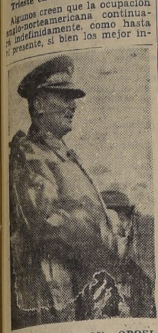
TITO ANUNCIA SU OPINION... SKOPLJE (Macedonia)

TRIESTE, 20. (UP.)— La tensión aljó hoy en esta disputada ciudad al convocarse los habitantes de que tropas italianas no llegaran aquí en ninguna fecha inmediata.