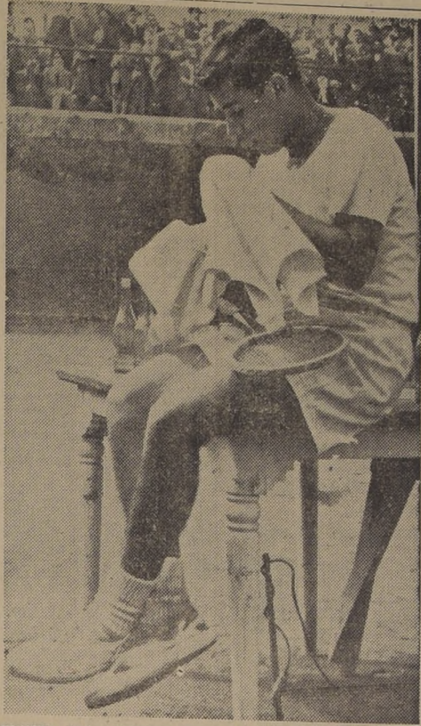
FIGURA DEL CAMPEONATO. — Ha sido, sin duda, en el torneo sudamericano que se está disputando en Colombia, nuestro campeón Luis Ayala...