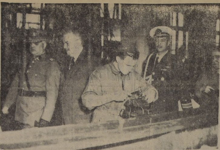
S. E. VISITA FAMA. Durante cerca de dos horas el Presidente de la República, señor Carlos Ibáñez del Campo, recorrió los extensos talleres de las Fábricas y Maestranzas del Ejército...