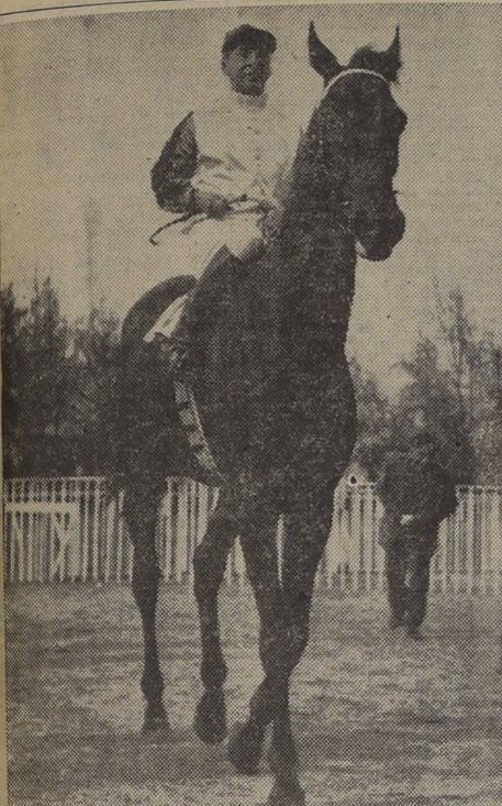
ANTAR, VENCEDOR EN "EL ENSAYO" de 1952, que cayó vencido con todos los honores en el "España" donde remató a una cabeza de Liberty...