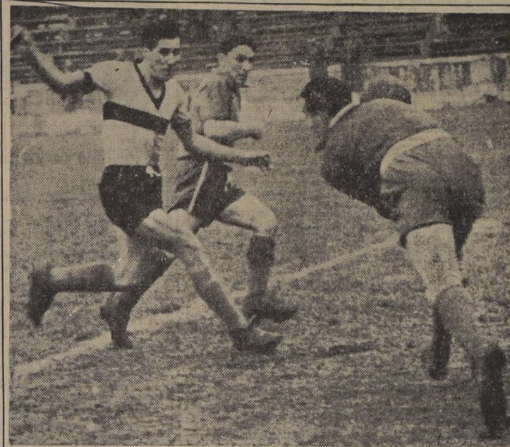
FERRO (2)-IBERIA (1).— Este fue el resultado en la primera rueda. Los hinchas de Iberia creen que mañana no se volverá a repetir. Confían en la recuperación del cuadro, que viene de empatar a 3 goles con Unión Española...