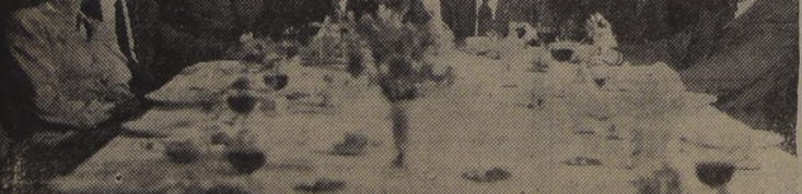
CELEBRACION DE ANIVERSARIO.— En el Restaurant Santiago, la Sociedad Inmobiliaria "Ercilla Ltda." y sus industrias anexas celebraron su quinto año de vida comercial...

La Municipalidad de Santiago dispuso un decreto que fija el cierre de los establecimientos comerciales de la capital, a las 20 horas de acuerdo con el horario llamado de verano.