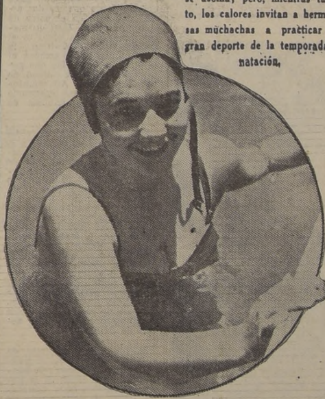
SE HACEN POCAS LAS PISCINAS. — Es el verano que ya se asoma; pero, mientras tanto, los calores invitan a hermosas muchachas a practicar el gran deporte de la temporada: natación.