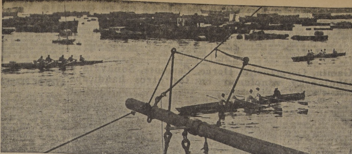
VISTA PANORAMICA DEL REMO PORTENO.— La pista de regatas de la bahía de Valparaíso, en un día de competencia, sorprende a los equipos del 'Canotiero', 'Valparaíso' y Unión Española de Deportes...

A 10-12 y 15 meses plazo, con $ 5.000 y $ 10.000 de pie.