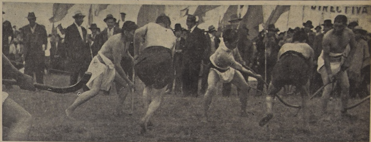
UN JUEGO DE CHUECA EN HONOR DEL ENVIADO DE S. E. — En la concentración de más de treinta mil indígenas que hubo en Temuco el sábado último...