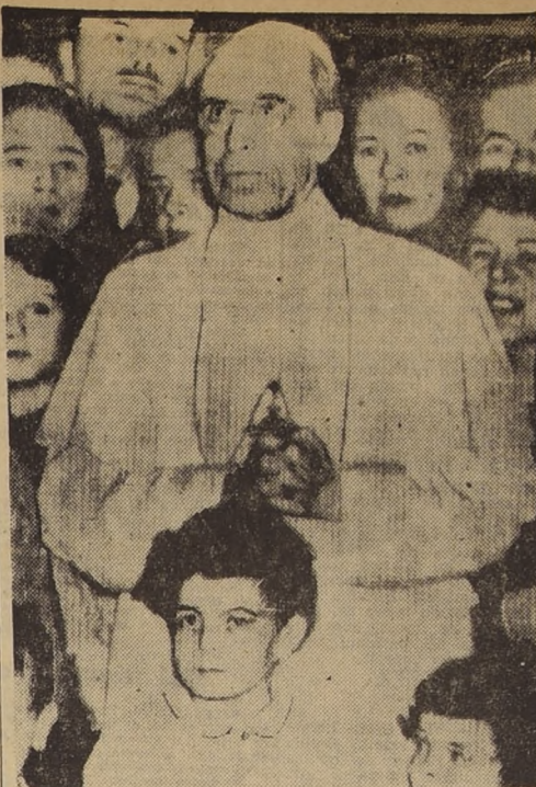
CIUDAD DEL VATICANO.— Esta es la última foto del Papa Pio XII tomada en la última audiencia. Nótese la presencia de niños entre los peregrinos. Un vocero del Vaticano anunció ayer que el Papa había pasado un día tranquilo.