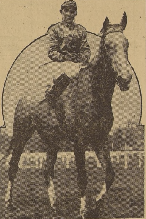
GAUCHO QUINTA, el excelente hijo de Abarquero, figura como uno de los candidatos con mejores posibilidades en el Handicap de Verano...