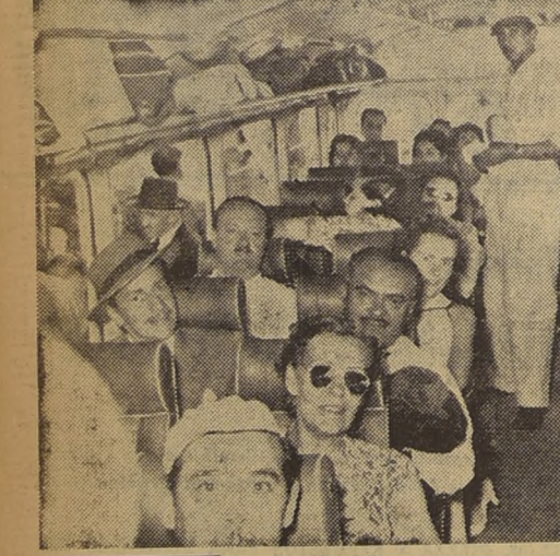
Vista del interior de uno de los cómodos vehículos que tiene en servicio la organización de transporte colectivo "Andes-Mar Bus", una de las más importantes firmas comerciales de la capital, que ha ofrecido gentilmente su colaboración a nuestro concurso "Miss Chile".

Entre las numerosas firmas comerciales que han ofrecido su más gentil y amplia colaboración al Concurso "Miss Chile", que auspician LA NACION y "Los Tiempos", conjuntamente con