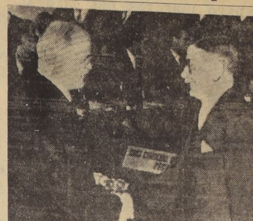
MOLOTOV DESPIDE AL CANCELLER DE AUSTRIA. — BERLIN, 18.— El jefe de la delegación soviética a la Conferencia de los Cuatro Grandes, estrecha la mano del Ministro de Relaciones Exteriores, Leopold Figl, al término de la reunión de Berlín, ayer, justamente cuando se terminaba de debatir el retiro de tropas de esa nación.

La política exterior soviética se basa en la premisa de que no es posible una decisión en los problemas internacionales de mayor importancia sin la participación completa de China Comunista. Este principio ha sido reiterado y recalorado en las últimas semanas, no sólo en los discursos de Molotov en Berlín, sino en decenas de declaraciones de los dirigentes soviéticos y en editoriales de prensa, en