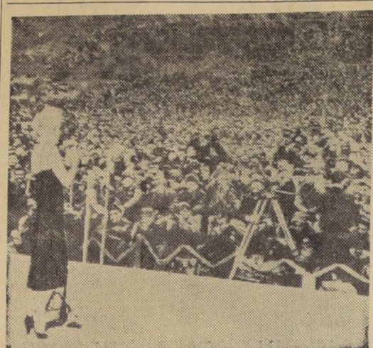
MARILYN MONROE EN COREA.— En un campamento norteamericano, Corea, 18.— La actriz de cine Marilyn Monroe ha actuado a "teatro lleno" ante los infantes de Marina norteamericanos que ayer la vitorearon en número superior a diez mil. De todos los puntos donde Estados Unidos tiene guarniciones, se lanzaron oleadas de "espectadores" para verla actuar.