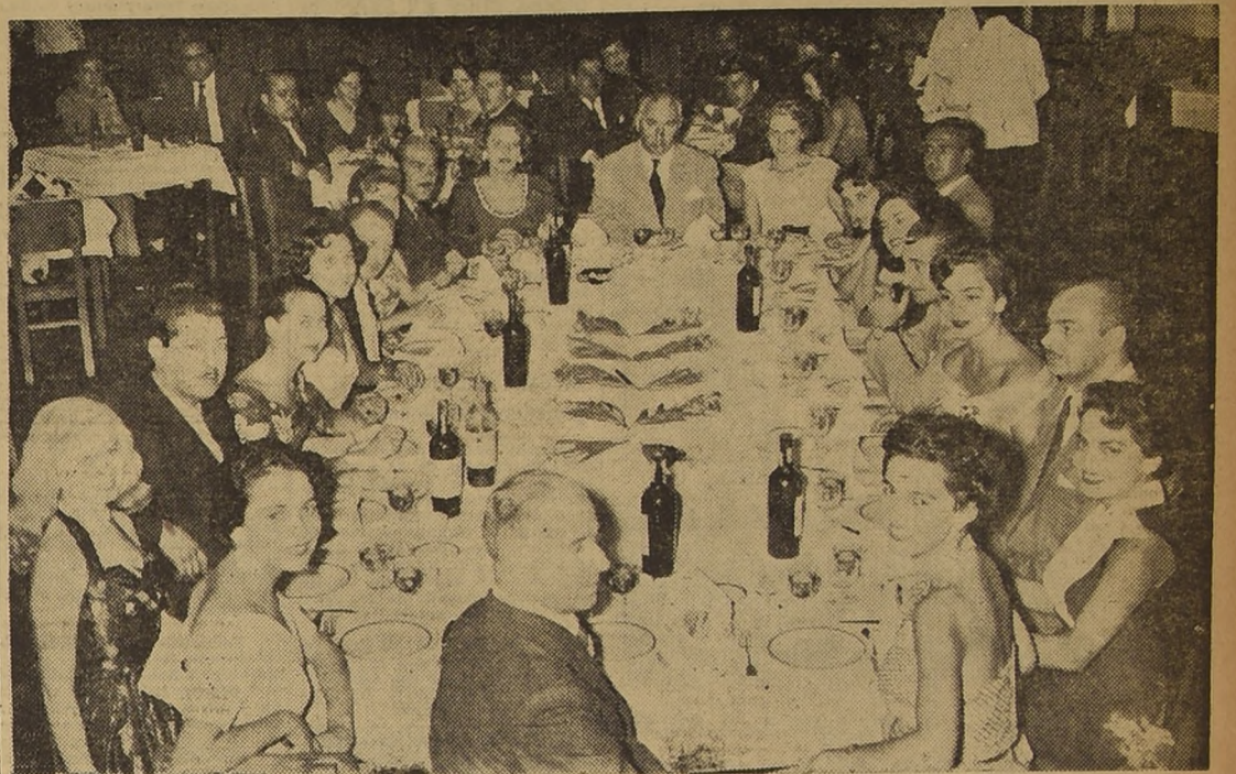
EN LA FIESTA DEL STADIO ITALIANO.— Mesa de honor de la fiesta ofrecida por el Stadio Italiano en honor de las doce ganadoras del Concurso Miss Ohle. La velada resultó agradabilísima, y los directores del Stadio se esmeraron en prodigar toda clase de atenciones a las simpáticas muchachas. Las utilidades de este acto serán a beneficio del "Ropero del Pueblo".

JOYAS FINAS Composturas de relojes garantizadas. ARGOLLAS 18 Kílates, con grabados: $ 1.600.— par CASA WEISS MAC S I V E R 142 Galería Local 13 - Fono 30684