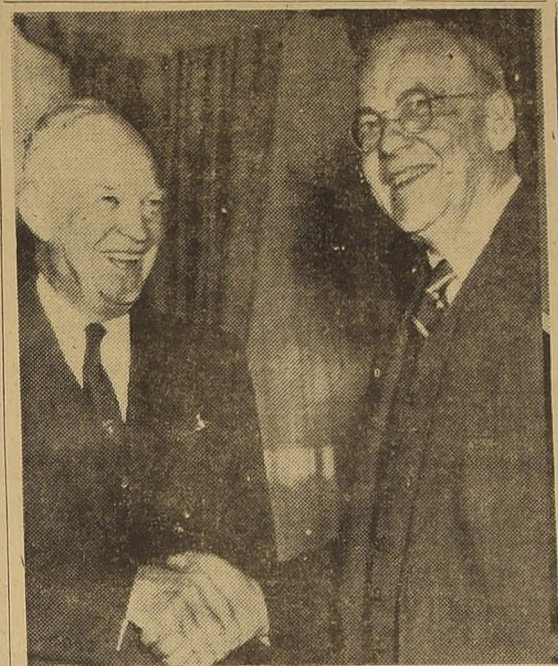
Excelentísimo señor Presidente de la República...