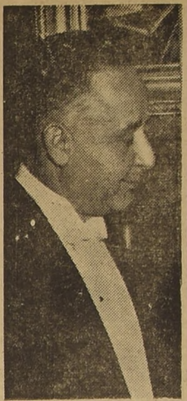
EVARISTO SOURDIS, Canciller de Colombia...