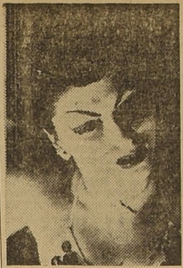
Chola de Sica, una espectacular vedette italiana, será presentada próximamente en uno de los principales escenarios de la capital. Actualmente se encuentra en Buenos Aires encabezando el elenco revisteril del Teatro Florida.

Desde el éxito de la primera película tridimensional de largo metraje "Bygone Devil", hecha en Anasco Color, hace más de un año las cintas 3-D, en forma o en otra, han estado permanentemente en los noticieros.