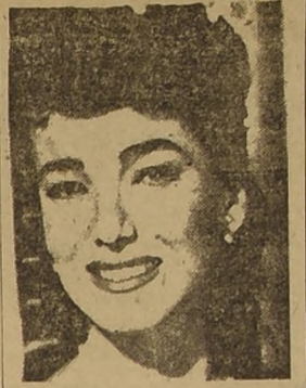
JULIA ADAMS es la encantadora rival de Piper Laurie en "La Octava Maldición", una extraordinaria película Universal-International en technicolor, que tiene por astro a Tyrone Power, y que va el jueves al Rex