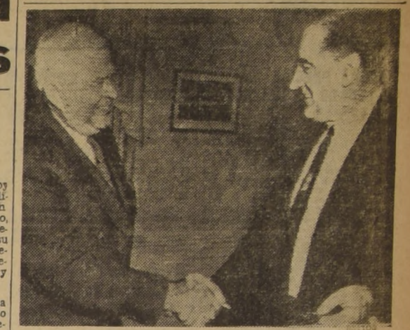
WASHINGTON.— El Secretario de Defensa, de Estados Unidos, Charles Wilson (izquierda) y el senador Joseph McCarthy se estrechan la mano después del anuncio de que no tienen "ninguna discusión" sobre el asunto de los subversivos en el servicio. El anuncio fue parte de una serie de actos de los líderes republicanos destinados a extinguir la controversia McCarthy antes de que dañara el programa del Gobierno en el Congreso y las posibilidades del partido en las elecciones de noviembre.