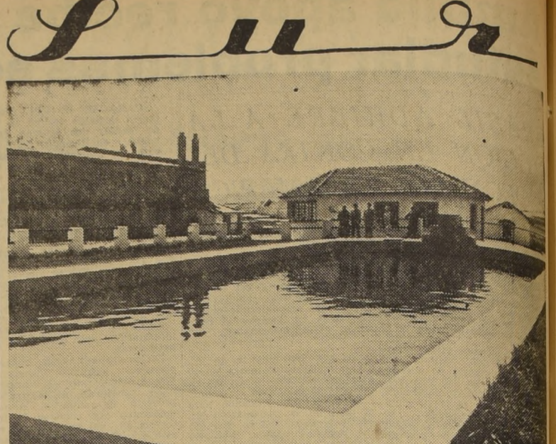
CONSTRUIDA POR CONSCRIPTOS - Esta hermosa piscina fue construida totalmente por personal de la Armada...