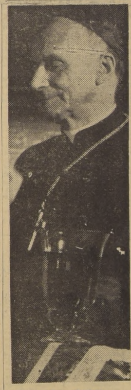
VISITO LA FERIA. —