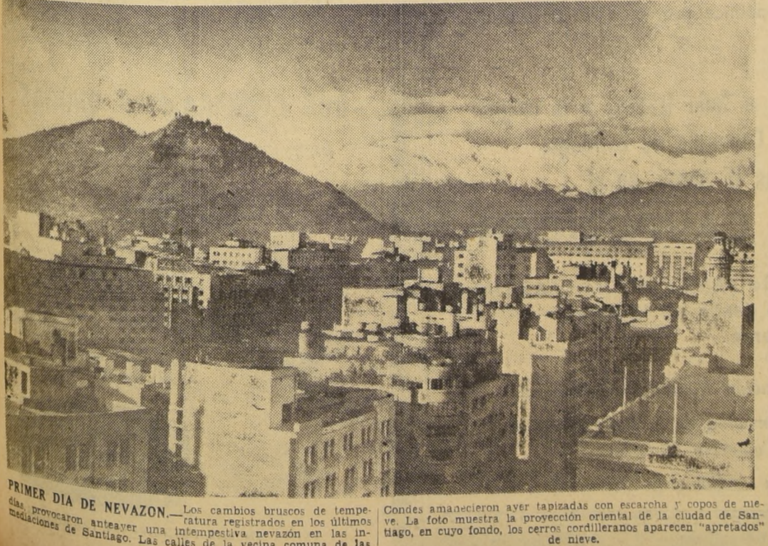
PRIMER DIA DE NEVAZON.— Los cambios bruscos de temperatura provocaron anteayer una imprevista nevazón en las inmediaciones de Santiago. Las calles de la vecina comuna de las Condes amanecieron ayer tapizadas con escarcha y copos de nieve...