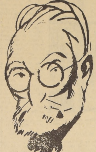
Don Miguel de Unamuno, dijo una vez, refiriéndose a los anglosajones con un olímpico desdén: "¡Que inventen ellos!"

Y es lo curioso que todos ellos afirman que no es posible perseverar en el criterio nacionalista de don Miguel de Unamuno, quien dijo alguna vez, al referirse a los anglosajones con un olímpico desprecio: "¡Que inventen ellos!". Quería decir don Miguel que a España le estaba reservado en el mundo el papel de mediar a Dios, soñar en el más allá, sumergirse y agonizar en el océano de las cavilaciones que se estreñan contra la dura realidad de la muerte. España debería volar al cielo con sus místicos y dejar al avión, el motor de explosión, la bomba atómica, la penicilina, los telares automáticos y los tanques de guerra. Para don Miguel la vida no es sino una simple preparación para la muerte, y este mundo presente no es sino un tránsito.