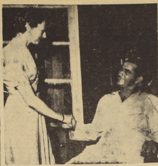
LA ESPOSA DEL HEROE.— HANOI, Indochina, 8.— (RADIO- PHOTO UNITED PRESS). — La esposa del general De Castries...