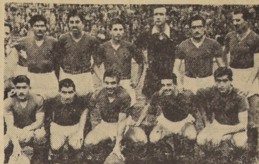
LA NOTA MAS DESTACADA de la sexta fecha la dio Unión Española con su claro triunfo sobre Green Cross.