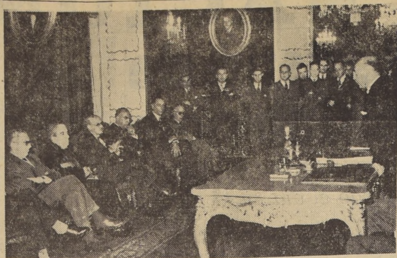
ACADEMIA DE ESTUDIOS DIPLOMATICOS. En la tarde de ayer se efectuó en el Salón Rojo de la Cancillería el acto inaugural de la Academia de Estudios Diplomáticos, cuya reciente creación ha significado un positivo aporte al perfeccionamiento de la capacidad funcional de los empleados del Ministerio de Relaciones Exteriores.

En la tarde de ayer se efectuó en el Salón Rojo de la Cancillería el acto inaugural de la Academia de Estudios Diplomáticos, cuya reciente creación ha significado un positivo aporte al perfeccionamiento de la capacidad funcional de los empleados del Ministerio de Relaciones Exteriores.