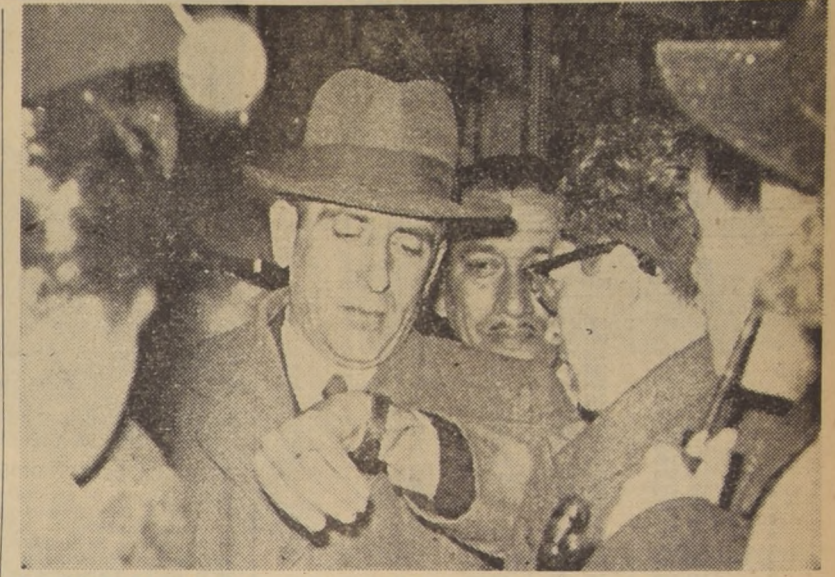
ANUNCIA SU DECLARACION. — Al retirarse de la Moneda, el senador Frei fue abordado por los periodistas. Este se excusó de hacer declaraciones. Mirando su reloj, en medio de un bosque de paraguas, anunció que entregaría más tarde una declaración escrita.

"El trabajo que presenté versó sobre las reformas de la legis-