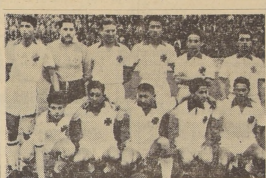
GREEN CROSS VIENE SALIENDO de una derrota con la Unión. Y para recuperar el terreno perdido necesita el domingo ganarle a Universidad de Chile.