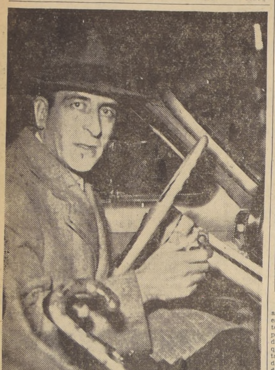
PARTE EN SU AUTOMOVIL. Luego de anunciar que haría una declaración por escrito, el senador Frei partió velozmente a redactarla. En el grabado, lo vemos en el momento en que pone en marcha su automóvil.