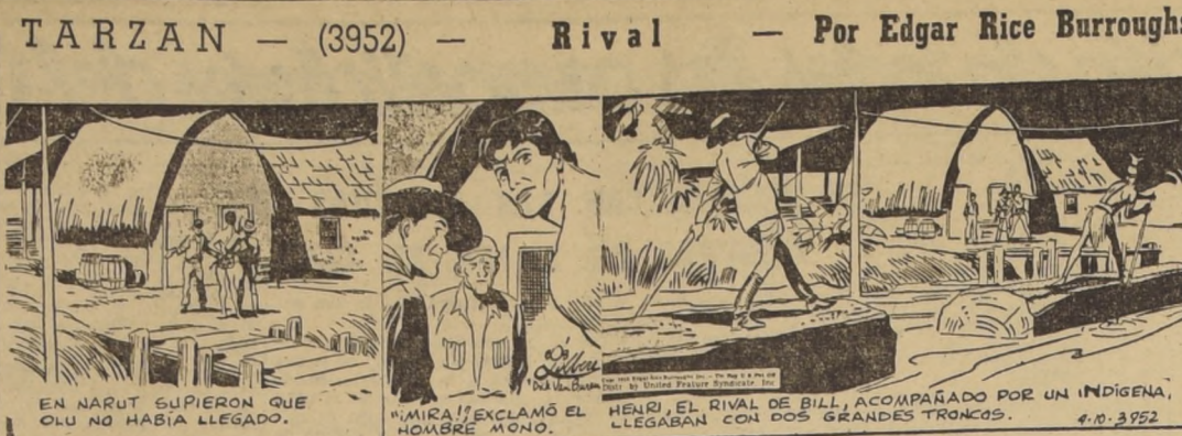
EN NARUT SUPERON QUE OLU NO HABIA LLEGADO.