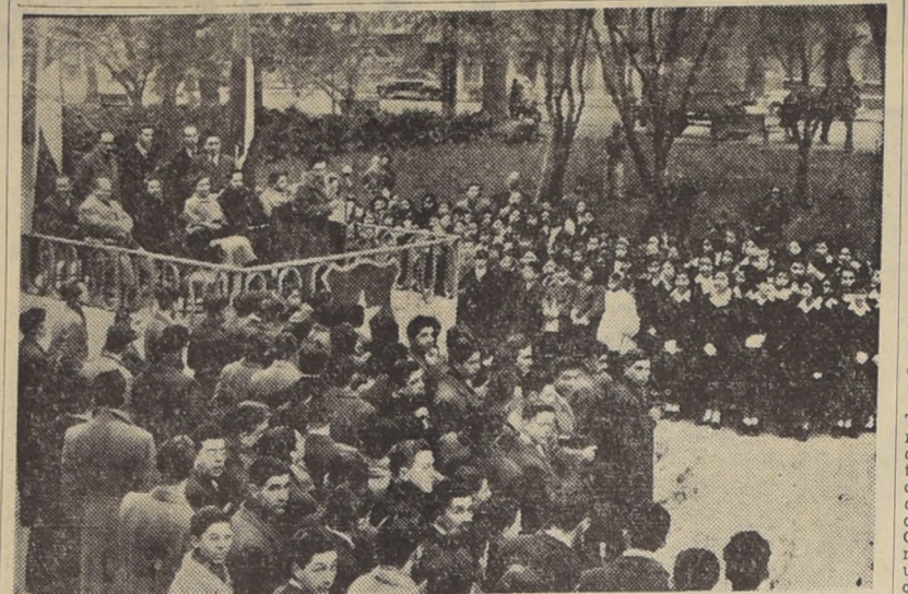
REANUDA CAMPANA DE ASEO. — La Alcaldesa de Santiago, señora María Teresa de Canto, es dirige a un grupo de escolares del Liceo de Niñas N.º 3 y del Instituto Nacional, durante el acto realizado ayer en el Parque Forestal.

LA INDUSTRIA ACTUAL EN CIFRAS. — Otros interesantes antecedentes que se consignaron en el Mensaje citado, y que revelan la enorme trascendencia de la industria y de la iniciativa, son los siguientes: 21.500 kilómetros cuadrados se han estudiado por geología y 11.000 por geofísica, hasta el 31 de diciembre de 1953. El área total en la misma zona con posibilidades petrolíferas, puede estimarse en unos 55.000 kilómetros cuadrados, de la cual un 25 por ciento se encuentra bajo agua. 70.000 metros se perforaron en el año 1953 (en 1951 sólo se perforaron 32.000 metros), con un total de 122 pozos; 53 han resultado productores de petróleo; 25, de gas, y 44, improductivos. Este porcentaje, en relación con trabajos similares