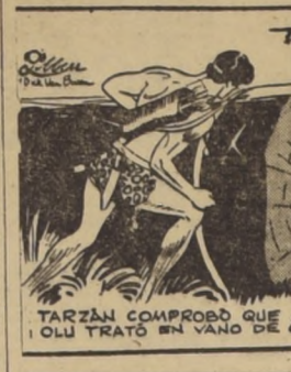
TARZAN COMPRO QUE AQUEL ERA EL MADRO QUE OLU TRATO EN VANO DE CONDUCIR.