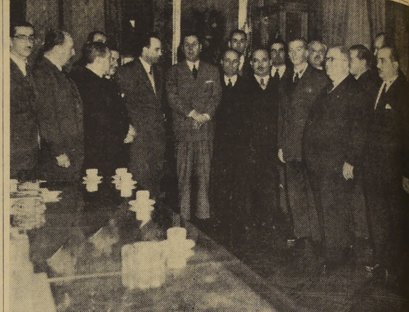
encuentran en esta capital como asesores de la comisión chilena que participa del Consejo General de la Unión Económica Chileno-Argentina, cambiaron impresiones con el jefe del Estado acerca de la contemplación industrial de los 15 representantes de esa entidad, quienes se

CONSEJO ECONOMICO CHILENO - ARGENTINO REANUDO SUS TAREAS. BUENOS AIRES, 19 (AL).— Las Comisiones de Trabajo designadas por el Consejo General de la Unión Económica Chileno-Argentina, reanudaron hoy sus tareas, desconociéndose que se producirán acuerdos de importancia, si se reúnen en sesión plenaria los delegados de ambos países.