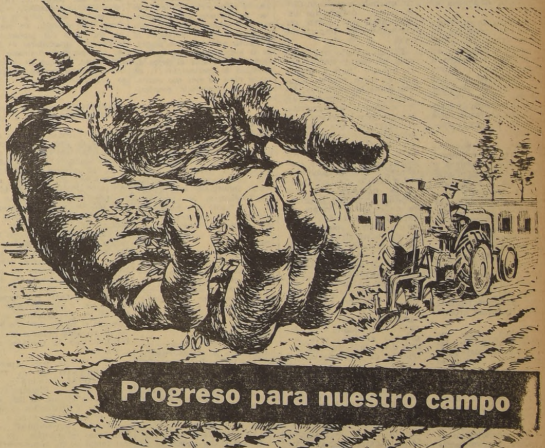
Progreso para nuestro campo