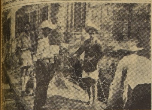
SE PREPARA PARA LO PEOR - HANOI (Indochina).— Tropas vietnamitas y civiles levantan alambradas de púa en Hanoi, en preparación para un ataque contra la ciudad por los comunistas. El Estado francés ha anunciado que los rojos conquistaron un tren importante de la carretera principal que hay entre la capital y una ciudad que está a 25 millas al noreste.

transporte mientras, por el otro, buques de carga de los países libres, buscan donde poder atracar. Los peticiones de guerra que ha enviado Estados Unidos en cantidades respetables, fusiles, ametralladoras, artillería, camiones, municiones, etc., están aplazados en bodegas bajo guardia por toda la ciudad, cuando no se les envía en aviones de transporte a Hanoi y Haiphong.