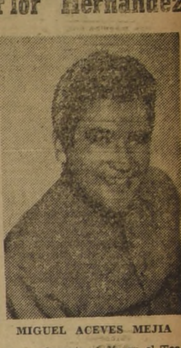
MIGUEL ACEVES MEJIA