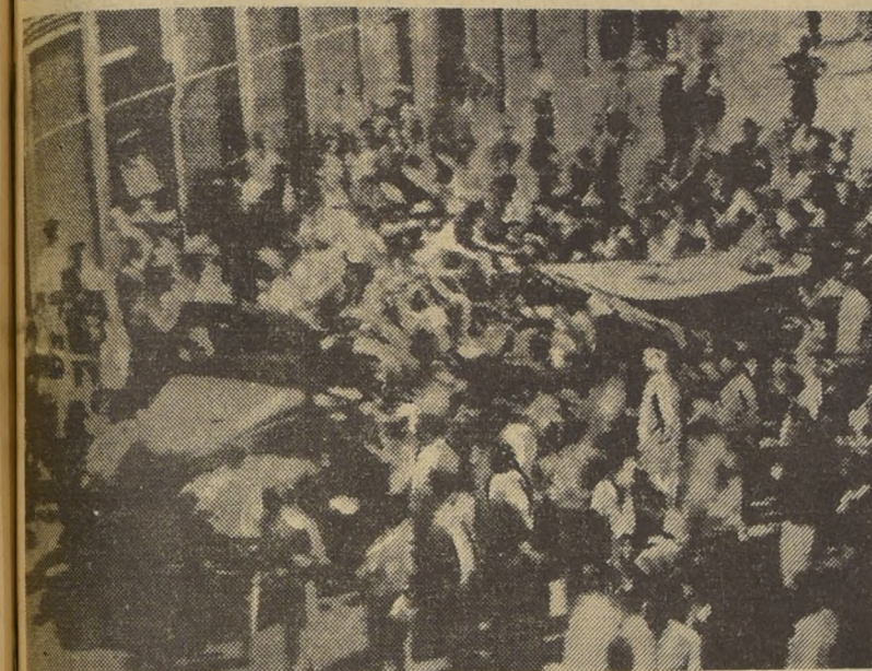
RIO DE JANEIRO. — Una ola de manifestantes hubo en esta ciudad al saberse que el Presidente Getulio Vargas se había suicidado. Los manifestantes volcaron e incendiaron tres camiones pertenecientes a periódicos. En esta radiofoto, se ve que un escuadrón de policía protege el edificio del diario vespertino "Tribuna da Imprensa", del cual Carlos Lacerda es director. Lacerda es antivarguista.