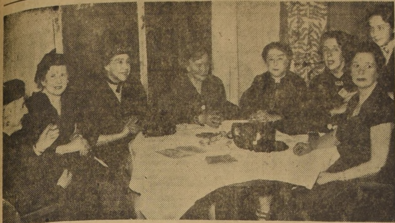
LAS ORGANIZADORAS del té-canasta a beneficio de las obras de la Parroquia de El Salvador...

PRIMER ANIVERSARIO DEL REGIMIENTO SIMBOLICO DEL ARMA DE INGENIEROS MILITARES.