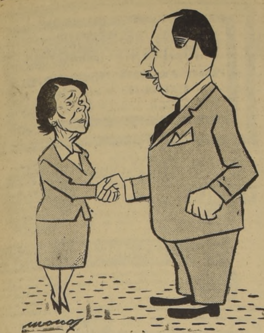
ALCALDE DE ROMA.—La felicito, Alcaldesa, Santiago es ejemplar; no tiene el grito destemplado de los diarieros ni el ruido infernal de las micros...