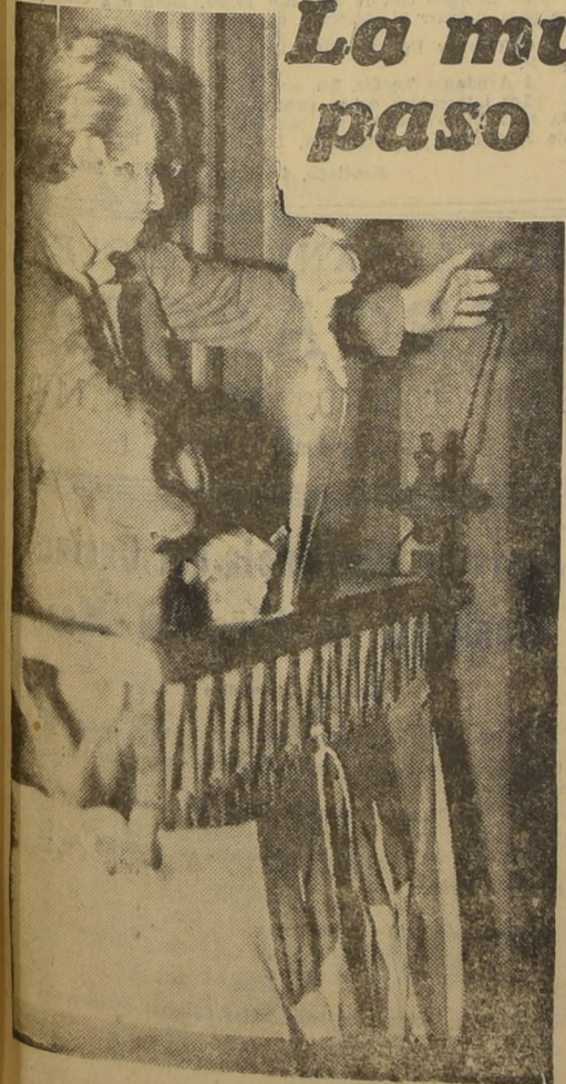
Hablando a su pueblo

Desfile triunfal de escolares a través de veinte cuadras