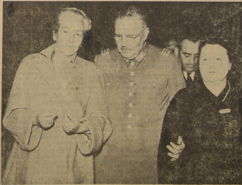
Del brazo del Presidente de la República, y acompañada por la Primera Dama, doña Graciela Letelier de Ibáñez, avanza Gabriela por los pasillos de la Moneda. La poetisa le dijo al Presidente "Tenemos mucho que hablar Excelencia. Pero después. Y a solas para contarle algunos proyectos que tengo y algunas ideas que deseo poner en práctica."

Emocionantes escenas de alegría, a lo largo de 20 cuadras, hicieron saltar sinceras lágrimas a muchos de los circunstantes. Forzando los cordones policiales, llegó hasta el costado del automóvil un crecido número de personas, de todas las edades, para regalarle una bandera nimbada del heroísmo de los tercios del 79, para entregarle ramos de gloriosas flores recién cortadas para ella, para entregarle un ban derín colegial, o simplemente para verle de cerca y para tocar su mano, tendida en gesto de maternal saludo.