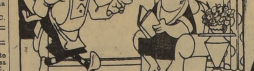
LA SEÑORA DE ENFRENTA ME PREGUNTO SI USTED ESTABA ENFERMA