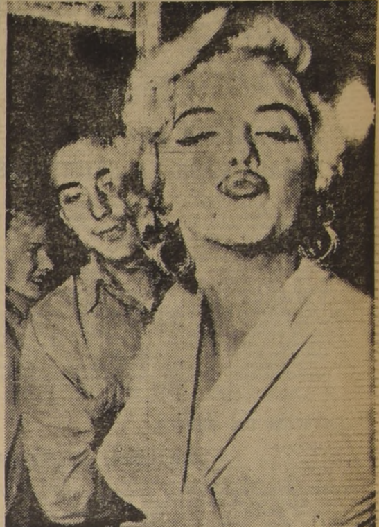
NOVA YORK.—La actriz Marilyn Monroe saluda con un beso a todos los que le dieron la bienvenida al llegar hoy al aeropuerto de esta ciudad...

DECLARACION DEL MINISTRO DE ECONOMIA.—El Ministerio de Economía entregó anoche la siguiente declaración: