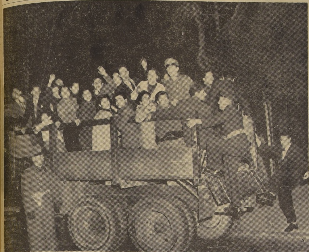
EL EJERCITO MOVILIZA AL PUBLICO.—Para superar las molestias que provocó el retiro de los microbuses particulares...

Hoy entrarán en servicio las máquinas requisadas