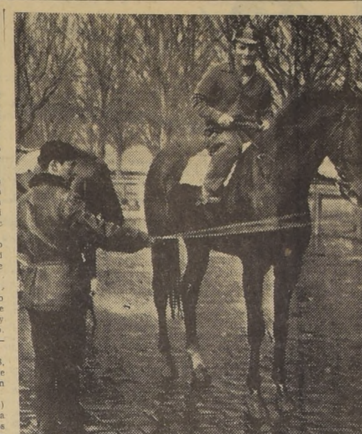
EL UNICO INVENTO—A pesar de que la línea de carreras está del lado de Abrantes, en la "Polla de Potrillo" va a ser favorito Ghirlandaio, ganador de dos brillantes victorias, por sus sobresalientes apromtes de la semana. Sus progresos son cada día mayores y la mayoría de los hipotecos lo estima el presunto crack de la generación.