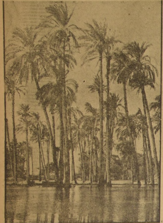
Y, lentamente, las aguas van cubriendo las superficies planas, calmando la sed de las palmeras, y renovando el suelo con la riqueza fecundante de sus sedimentos.

EL CAIRO. (Intercontinental, AFP).— La crecida del Nilo batió en 1954 todos los records del siglo. Más de mil millones de metros cúbicos de agua fanfosa se deslizan diariamente entre la pri-