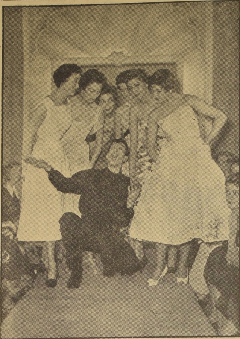
PARIS.— El cantante Philippe Clay asistió especialmente invitado a la exhibición de modelos de la casa Jacques Heim. El artista deleitó al encantador auditorio con algunas canciones, tal como las interpretó en el film "French Can-Can".— (Foto Intercontinental).