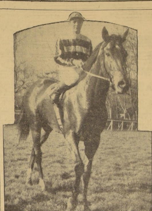
CON 64 KILOS.— A raíz de su aplastante victoria en el clásico "España", se habló mucho del estado de Biriatiou.

grado figurar la hija de Cockney y Alforja. ONDA REAL, 53; F. Pizarro.— Reciente cuarta de Antioquia y corral con Astuta.