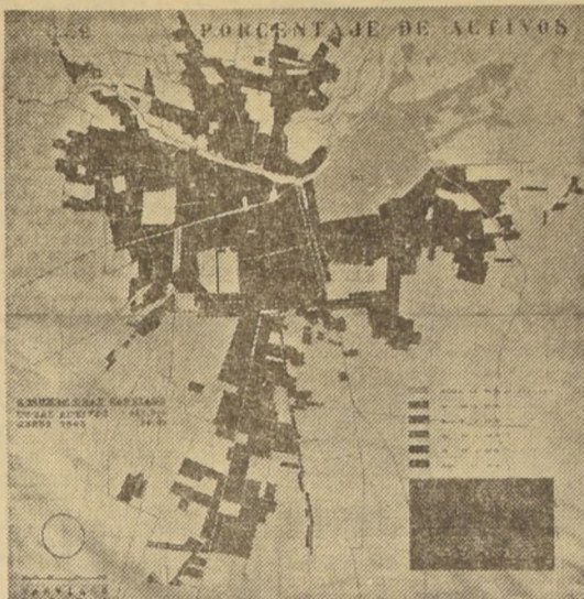
La Facultad de Arquitectura de la Universidad de Chile realizó un interesante trabajo de análisis del Gran Santiago, que es lo más completo realizado hasta la fecha. Este grabado reproduce el análisis del porcentaje de población activa. Las partes de color negro corresponden a las zonas de mayor porcentaje. Este disminuye en los barrios residenciales, lo que se advierte en las partes grisadas.