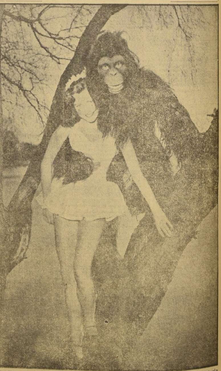
BERLIN.— Lo que Ud. está viendo, amigo lector, es la Bella y la Bestia, historia de la cual se han filmado varias películas, y que ahora es representada en un teatro de esta ciudad alemana. En la fotografía vemos a la Bella y a la Bestia, durante uno de los ensayos que se efectuaron a orillas de un lago del sur de Alemania. Esta pieza dramática ha tenido gran éxito.