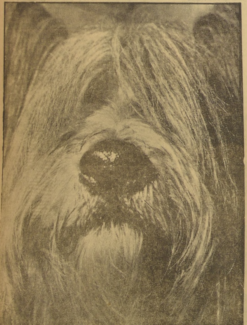
PARIS.— "Yousef Bouchad-Aigre", competidor importante en la exposición canina efectuada en el Velódromo de Invierno de París, muestra el "peinado" que adoptarán los perros "elegantes", según la moda para el año 1955: se trata del estilo "Saint Germain des Press".— (Foto Intercontinental).