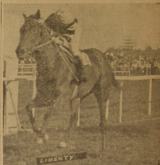
LIBERTY, por Treble Crown y Huronera, ganó EL ENSAYO en 1951. Esta foto recuerda justamente ese final viéndose el "crack" en cómodo galope y su jinete observando hacia atrás a los rivales que no alcanzaron a entrar en el lente del reportero gráfico.

de "El Ensayo". Ha sido arreglada y regada científicamente y, de acuerdo con las informaciones que nos ha proporcionado nuestro reportero de cancha, que la recorrió ayer en toda su extensión, estará en perfectas condiciones.