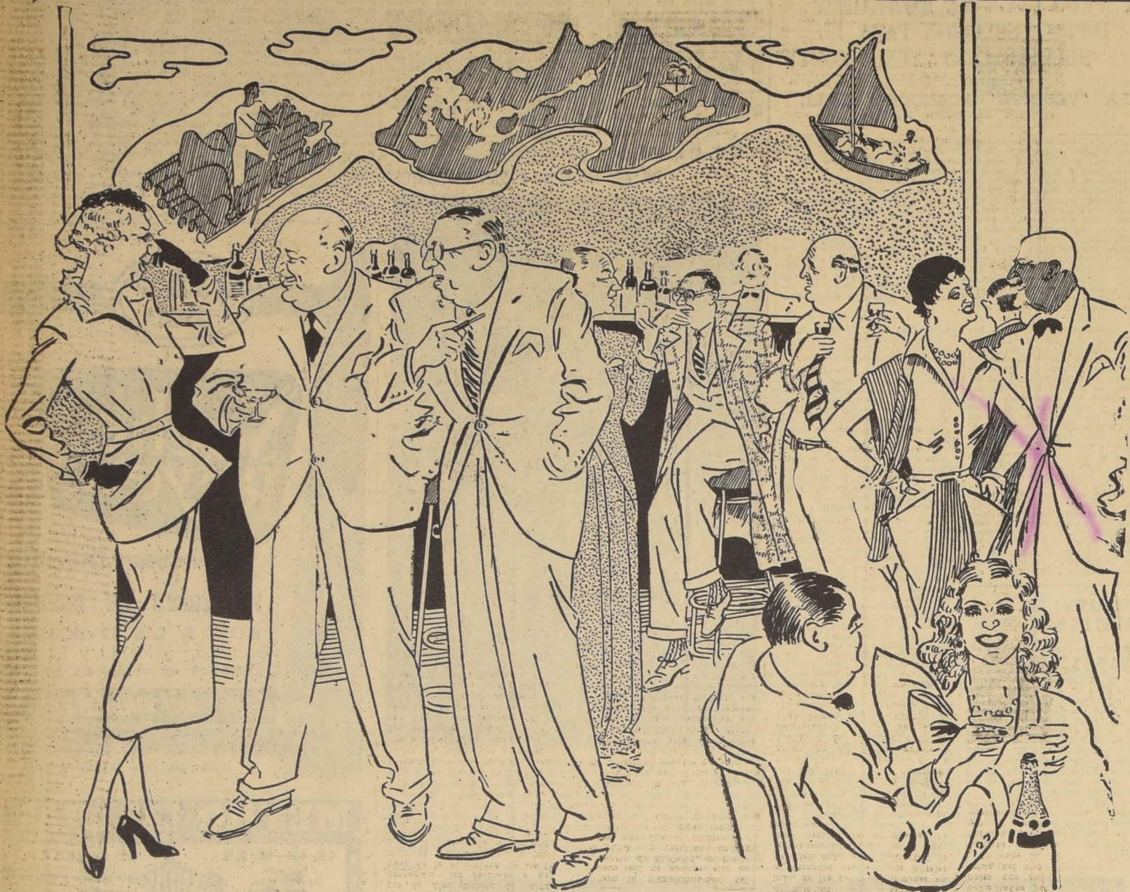
En este apunte de Mundo, captado en el Bar del Carrera, se puede observar a conocidas figuras de nuestro mundo social.