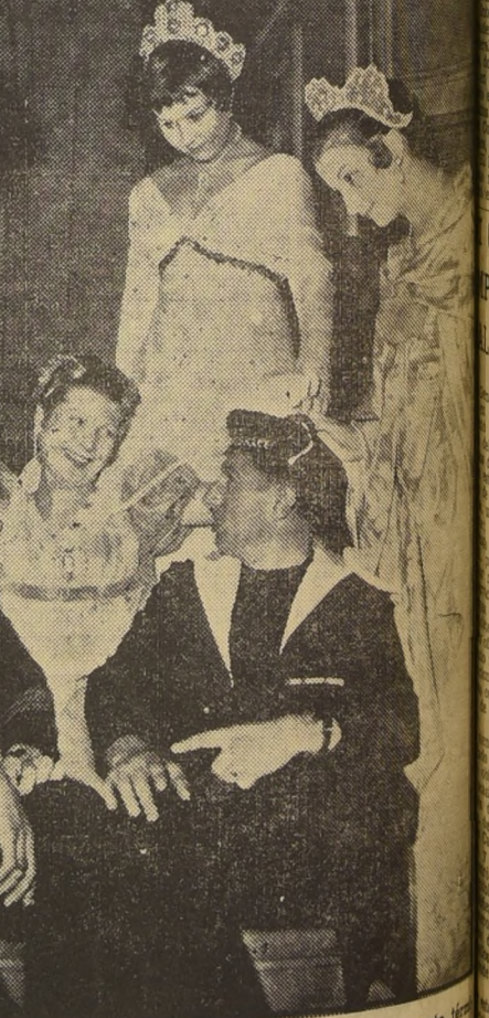
PARIS.— En los salones del Ministerio de Marina, Sacha Guity ha puesto fin no a la filmación de su gran obra "Napoleón". Un grupo de muchachas que representaba a las damas de la Corte Imperial, aprovecharon la presencia de dos modelos para cumplir con una superstición: tocar los pompones rojos de sus sombreros para traer suerte.

Los turistas podrán disponer de otros palacios reales, a más de los ya mencionados. El palacio de Montazah, cerca de Alejandría, se convertirá también en hotel-casino. Sitúa en un promontorio poblado de árboles que se adentra en el mar, no lejos de Abukir, dicha morada consta de un puerto privado para los yates, de una estación de pesca submarina y de cuatro playas delimitadas por los grandes árboles que se arriaman hasta la orilla del mar.