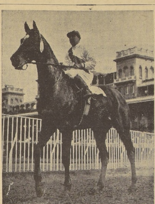
HEROE.— Está acostumbrado a lucirse en los mejores lotes de especialistas para distancias cortas y es uno de los bravos competidores de la Carrera Especial "Luis Dávila Larrain".

Hoy comienza en las oficinas centrales y sucursales de los hipódromos de la capital, la venta de boletas para el trigésimo día del Concurso de Pronósticos que se combina esta semana con las ocho primeras carreras del Hipódromo Chile.