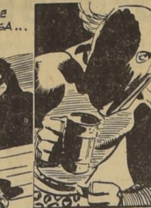
Por Chester Gould