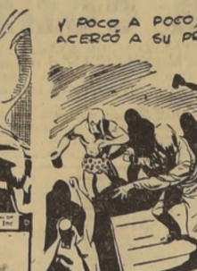
Por Edgar Rice Burroughs