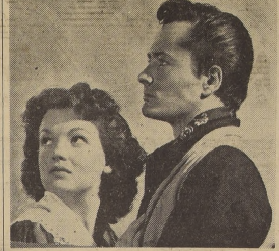
John Derek y Joan Evan funden en estrecho abrazo sus ansias de amor, en la joya Republic, de acción y pasión, que irá al T. Victoria el miércoles próximo. Se trata de cinco estrenos de primera línea, que serán proyectados en pantalla gigante y con el revolucionario sistema Superscope.

"CONTIENDA POR UN IMPERIO" EN EL FESTIVAL DE AVENTURAS REPUBLIC QUE SE INICIA EL MIERCOLES