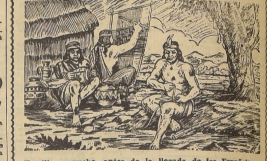
Familia mapuche, antes de la llegada de los Españoles

LA GUERRA SANTA —Ya no fue cosa más que de matarse y matarse. —En cuanto un español veía a un indio lo mataba inmediatamente sin preguntarle ni cómo se llamaba. —Y los indios hacían lo mismo con los españoles en cuanto los pillaban con las manos ocupadas en algo. —Por ejemplo, en pellizcar. —La tierra es del mismo color. —Y del mismo color son los animales y los insectos y los indios. —Hay que tener el ojo educado a distinguir los matices del marrón, para saber cuándo es un indio desnudo, cuando es un árbol, cuando es una roca, cuando un montón de cucarachas o una bandada de pájaros.