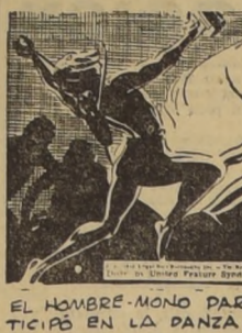
EL HOMBRE-MONO PARTICIPÓ EN LA DANZA