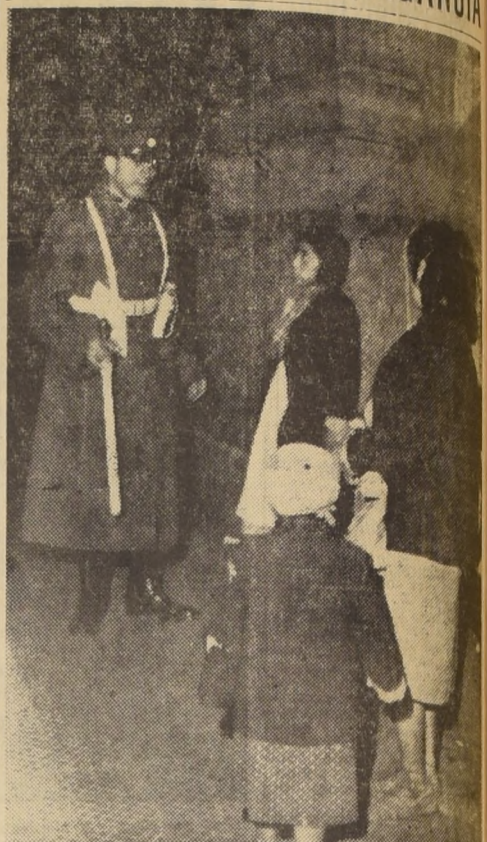
Mediante la campaña que iniciara a pedido expreso del Primer Mandatario...