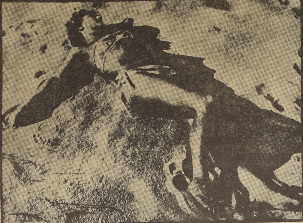
NUEVA VERSION PARA LAS CANCIONES DE BILITIS un emocionado tributo a su belleza, ella recibe, entonces, la pleitea de los seres y las cosas. Pierre Louys, sin duda, habría escrito con este tema, —ella, la playa, el sol y el mar—, una nueva versión de sus Canciones de Bilitis.