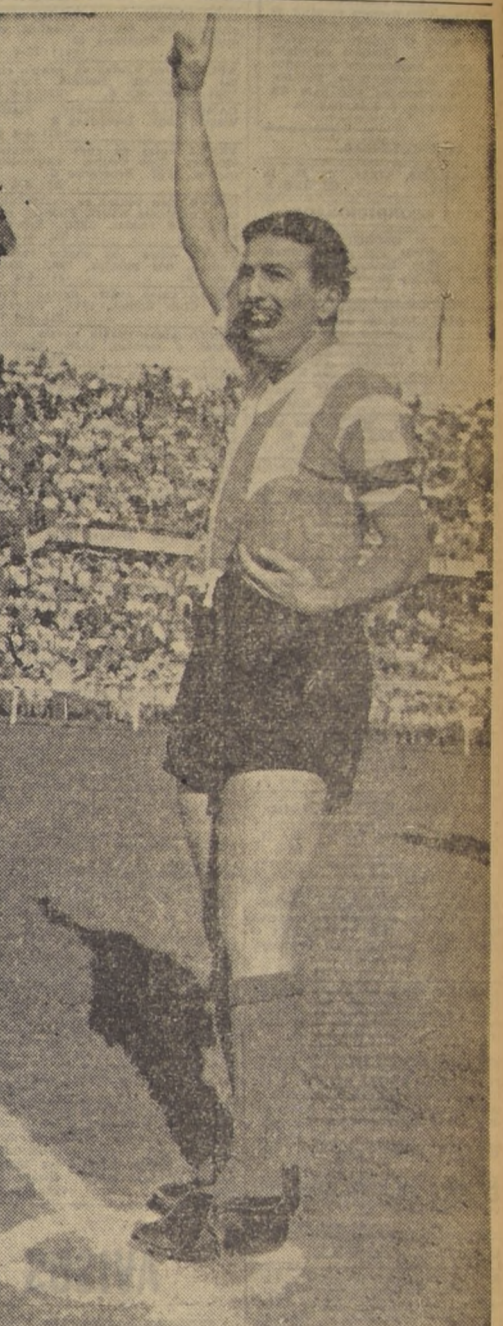
GRAN CAPITAN. — Y figura de méritos indiscutibles, en el cuadro en las canchas del Continente y que goza de especial estimación en el público chileno...