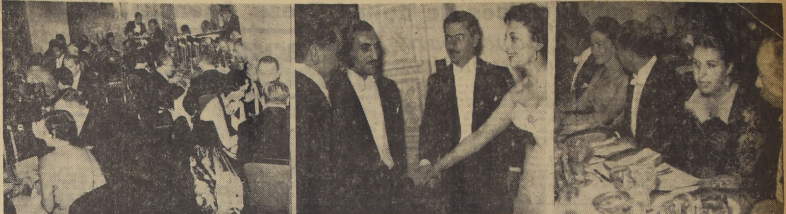
BRILLANTE FUE LA COMIDA-BALLE QUE SE EFECTUO EN LA EMBAJADA CHILENA EN HONOR DEL PRESIDENTE PAZ ESTENSORO...