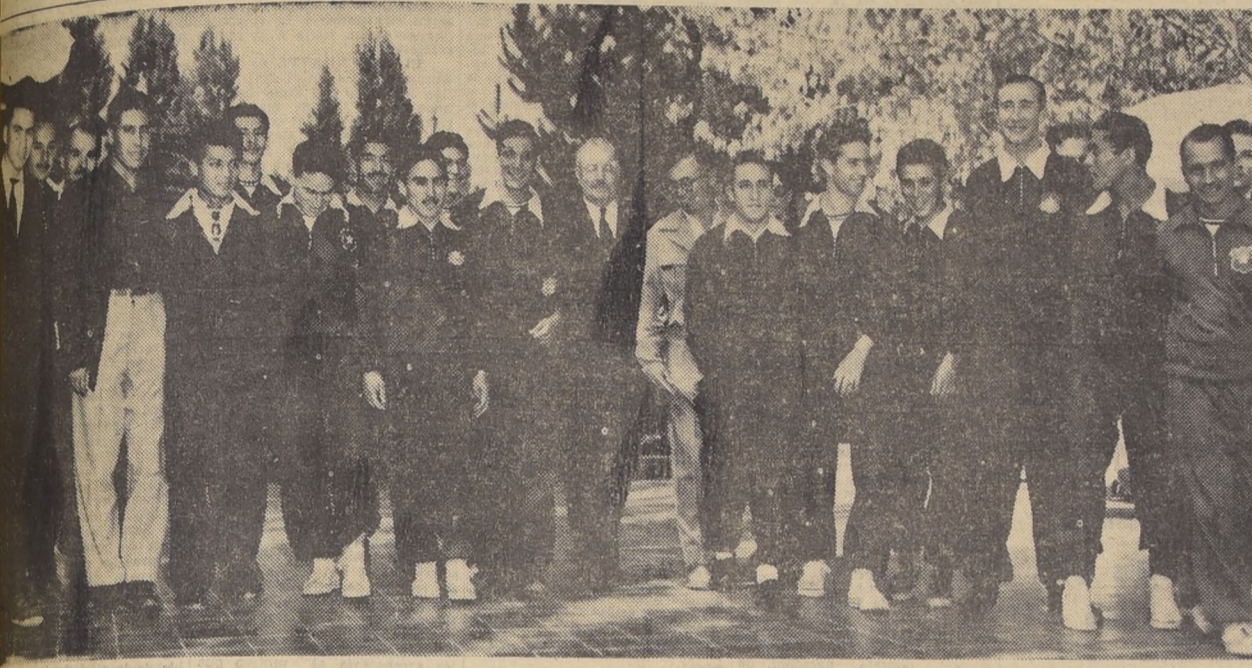
En un democrático gesto, S. E. el Presidente de la República, acompañado de su señora esposa, doña Graciela Letelier de Ibañez, visitó ayer, a mediodía, a los integrantes de la selección chilena de fútbol, en el Estadio Italiano. Y se quedó a almorzar con ellos. Sin protocolos ni etiquetas, compartió con los muchachos, de la misma mesa y el mismo plato. Aquí vemos al Jefe del Estado cuando avanza por la terraza del hermoso campo