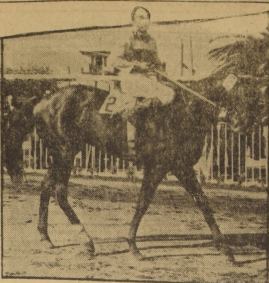
ATENEO.- Un "dato" que circula con insistencia en la cancha. Correrá en la quinta carrera del Club Hípico, con 50 kilos, y sus trabajos últimos indican que puede ser el vencedor.

Mientras los profesionales de la caza de caballos resisten el nombramiento de un nuevo administrador para el Club Hípico, los empleados de este club resisten el nombramiento de un nuevo administrador para el Club Hípico, con premios que totalizan el récord de 152.500 dólares.