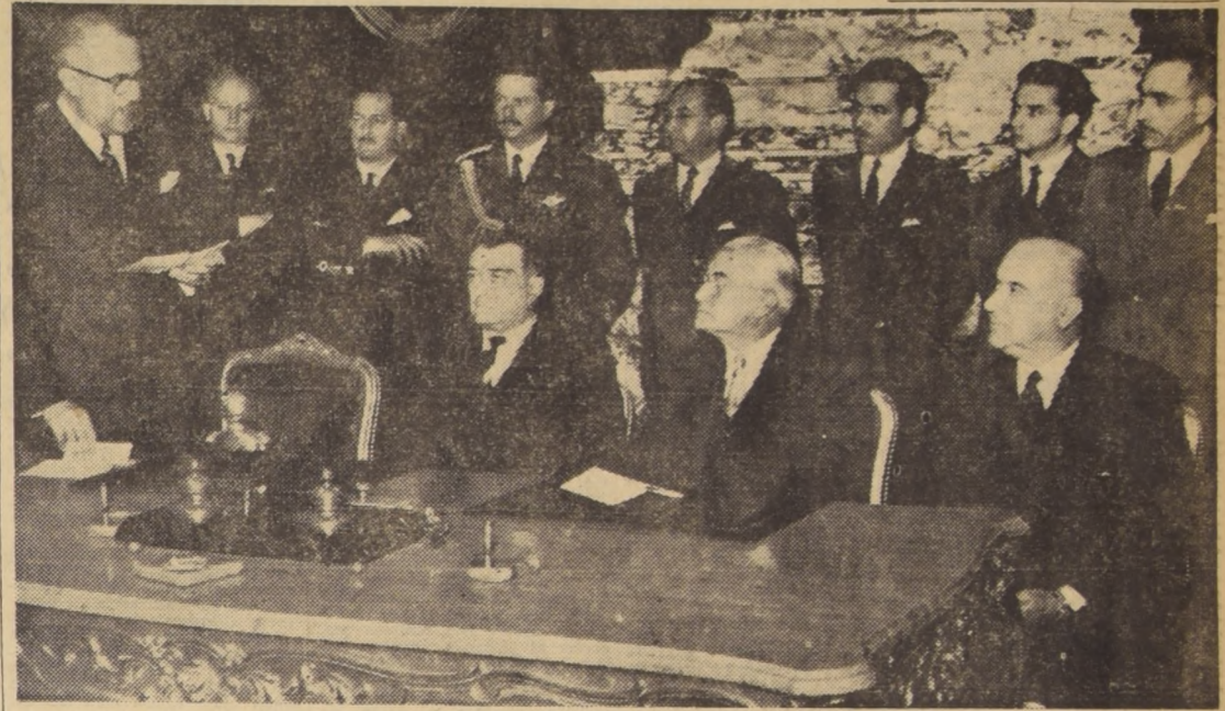
El Presidente del Consejo Nacional Argentino de la Unión Económica, señor Ildefonso Cavagna Martínez, aparece en el grabado pronunciando el discurso en la sesión inaugural del III Consejo General del Acta de Santiago...

Inaugurado Consejo Económico Chileno-Argentino