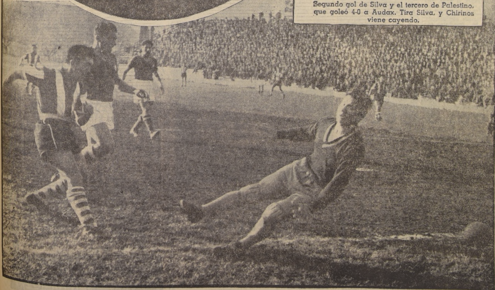
Segundo gol de Silva y el tercero de Palestino, que goleó 4-0 a Audax. Tira Silva, y Chirinos viene cayendo.