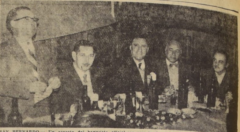
SAN BERNARDO.— Un aspecto del banquete oficial con que la Sociedad de Socorros Mutuos de San Bernardo celebró el 50 aniversario de su fundacion...