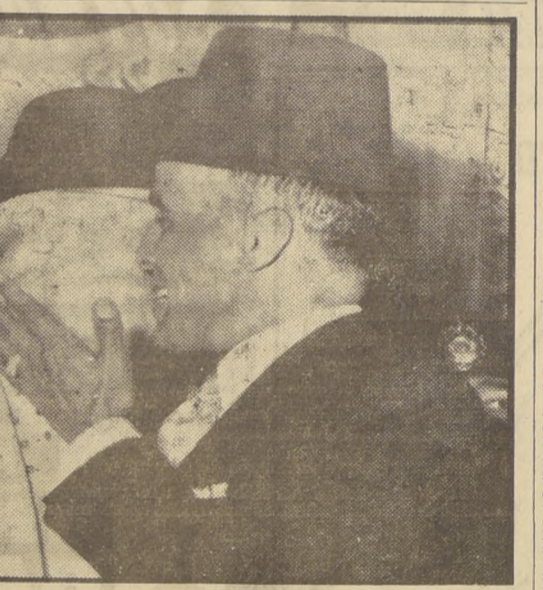
A su llegada a Tánez, el líder tunecino Habib Bourguiba fue recibido en el Palacio de Cartago por Su Alteza, el Bey, quien, contra las reglas del protocolo, se levantó del trono para saludarlo. Bourguiba pasó tres años fuera del país.

La Comisión Permanente de Presupuestos de la Superintendencia de Educación Pública sesionó ayer, para iniciar el estudio del anteproyecto de gastos educacionales para 1956, remitido por el Subsecretario al Consejo de la Superintendencia para su estudio en conformidad con las disposiciones del artículo 6.º del Decreto con Fuerza de Ley N.º 104.