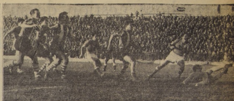
ESTE PASAJE de la brega corresponde a los jugadores de Audax Italiano, que se defiende por el ataque. Palestino, en el fondo, se defiende por el ataque. Palestino, en el fondo, se defiende por el ataque. Palestino, en el fondo, se defiende por el ataque.