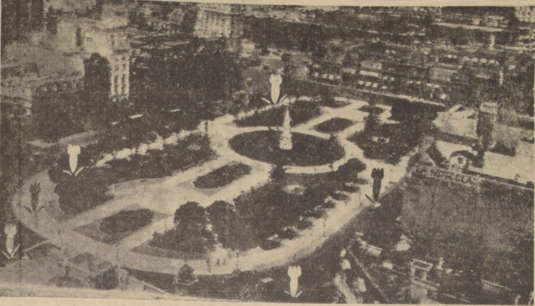
Seis bombas sobre la Plaza de Mayo