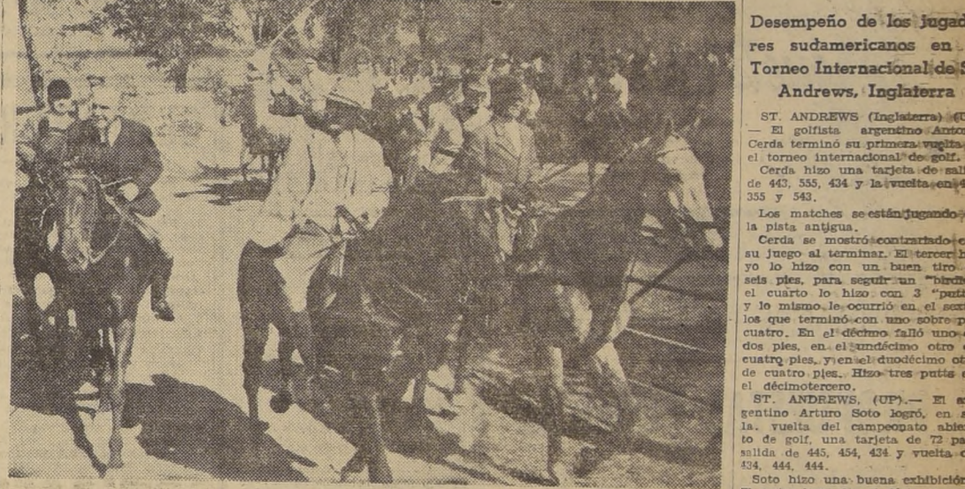
Con motivo de la celebración de 50.º aniversario del Santiago Paperchase Club, la prestigiosa entidad nacional ecuestre...