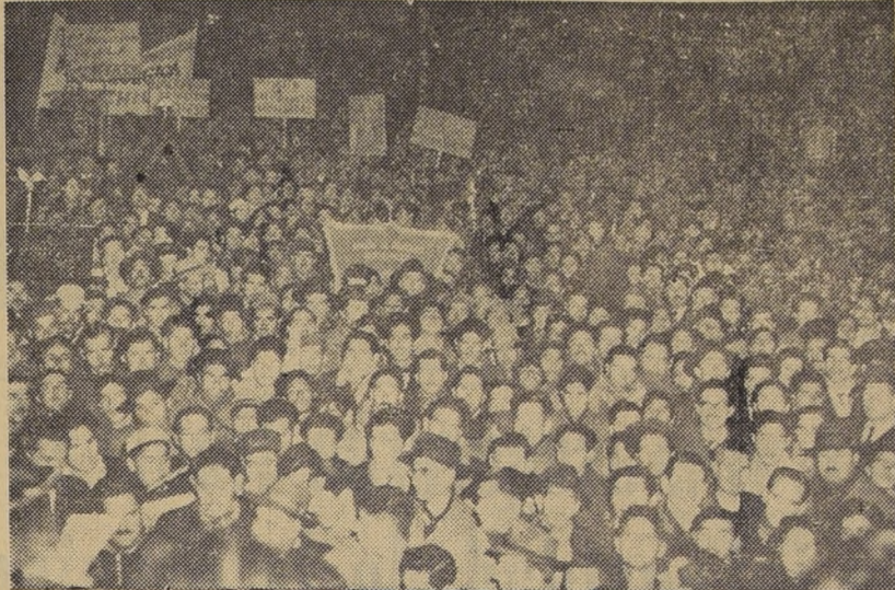
Un aspecto de la concentración organizada anoche por la CUT, con la cual se dio comienzo al paro nacional.