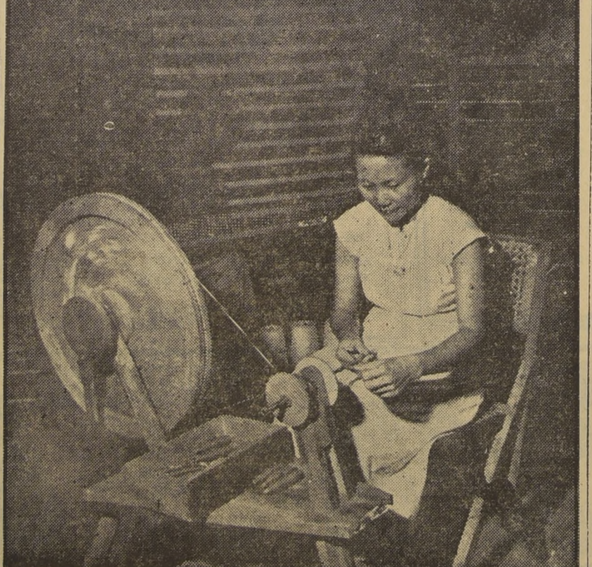
MANILA.— Después de la guerra, las tejedoras de las Filipinas debieron emprender una nueva competencia con las tejedoras importadas, y muchos de sus husos y telares quedaron inactivos. Sin embargo, y gracias a la ayuda de un experto tejedor de las Naciones Unidas, que las adiestró en los métodos más modernos, las operarias de la industria textil filipina aprendieron, fácilmente, a realizar simples alteraciones en sus elementos de trabajo, con lo cual el problema quedó solucionado. Así, en efecto, han logrado producir telas de más venta y menor costo, que satisficieron las necesidades de los nuevos mercados.