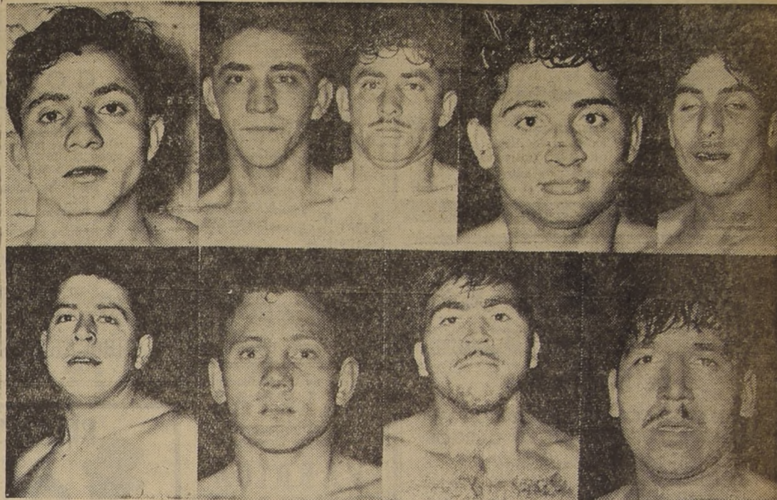
CAMPEONES - Presentamos a nueve campeones de novicios clasificados recientemente en la competencia de la Asociación Santiago...