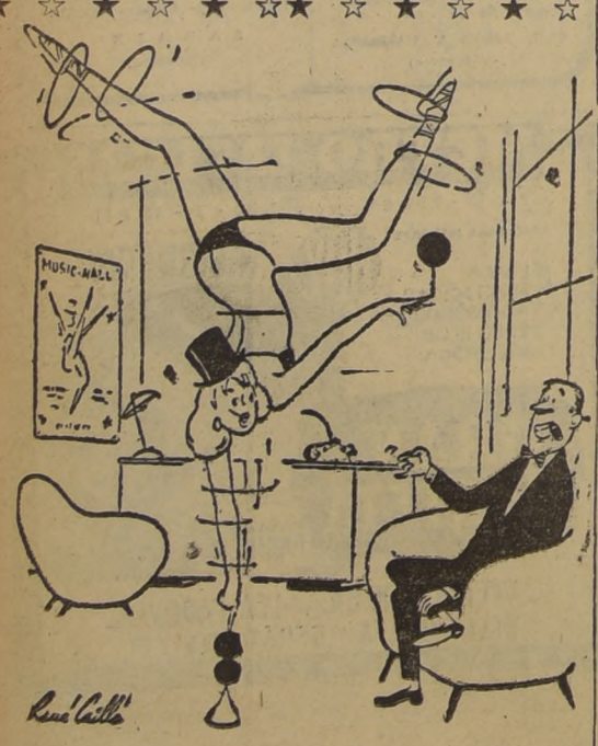
EL EMPRESARIO.— Su número sería sensacional si usted, además, tocara el violín...

Concebido de tal manera, nuestro "venturi" de llamas no daría más que un débil impulso, con deplorable rendimiento, pues en la práctica es indispensable expulsar enormes masas de aire hacia atrás. Para lograrlo, Leduc ha caído su diablo de llamas en las entrañas de un diablo mayor, este en otro de mayor tamaño, y así hasta cinco diábolos. Tal disposición produce un efecto de "tromba", pues enormes masas de aire inerte quedan empujadas y proyectadas hacia atrás sin participar en la llamarada. De tal modo, el impulso motor sube de golpe, alcanzando la formidable cifra de sesenta toneladas en el prototipo "55"... y sin ninguna pieza giratoria... "Ya tenemos la "lámpara de soldar que vuela".