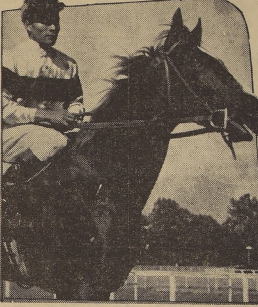
CORONADO, que a pesar del alto peso que llevará en el clásico "Agustín R. Edwards"...