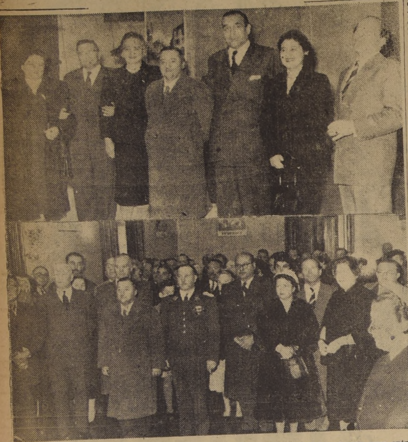
La colectividad francesa de Valparaíso y los amigos de Francia están celebrando con gran entusiasmo el Día Nacional de esta gran República, unida a Chile por tradicionales vínculos de amistad...