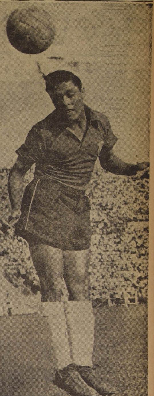
EN UN MOMENTO en que su concurso se está haciendo sentir, jugará el domingo en el clásico match de los albos frente a Unión Española...