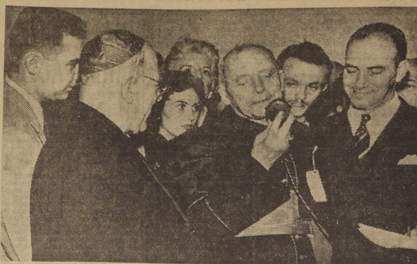
RIO DE JANEIRO.— Llega a Rio, para participar en el Congreso Eucarístico Internacional...