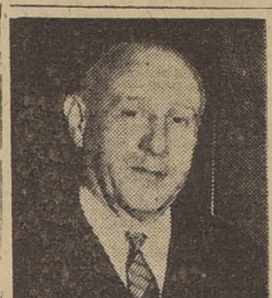
Presidente del Senado, don Fernando Alessandri.