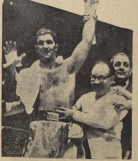
Rocky Marciano el formidable campeón del mundo de todos los pesos, invicto en una trayectoria de valor extraordinario, y que anoche eliminó a su más peligroso adversario, Archie Moore, por K. O. en el 9.º round. Ya en la 6.ª vuelta Marciano atacó fatalmente a su rival, salvándose éste por la campana. Rocky parece ser un campeón invencible.

Ante 60 mil personas que pagaron 900 mil dólares