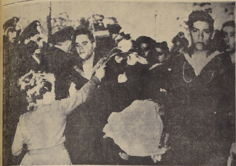
MONTVIDEO.— Una niña deposita flores sobre el ataúd de un marino argentino no identificado, que subió en la...

La situación del ex Presidente Perón será decidida por el nuevo jefe