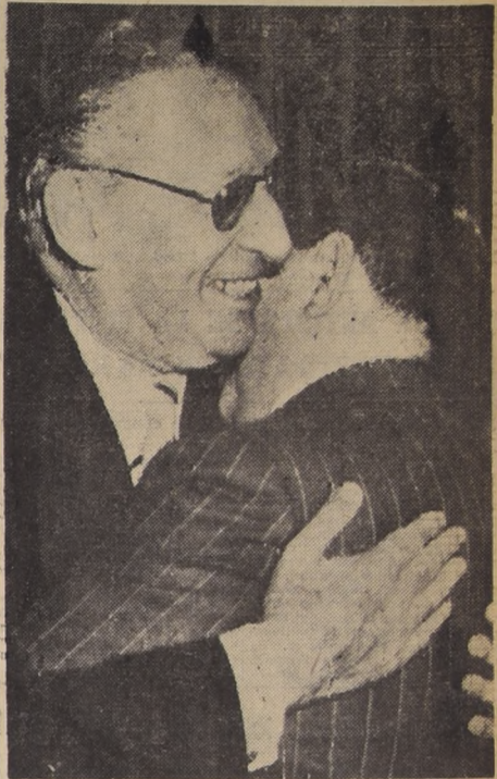
NACIONES UNIDAS.— José Maza (izquierda), jefe de la delegación chilena ante las Naciones Unidas, se abraza con el delegado de México, Padilla Nervo, antes de la sesión inaugural de la Asamblea General, el 20 del presente. El primer asunto en el orden del día era la elección del Presidente de la Asamblea, recibiendo Maza la unanimidad de votos de las 60 naciones representadas en la reunión.