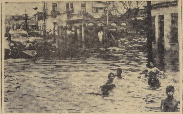
TAMPICO, México.— Extraño contraste ofrecen éstos niños que se bañan en las aguas de la inundación...