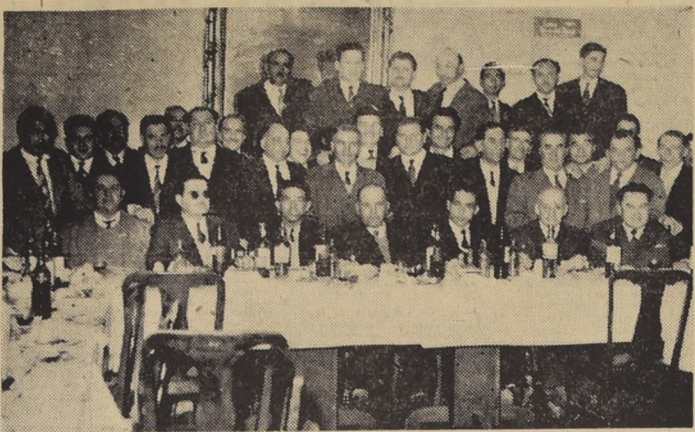
Aspecto del banquete de camaradería, organizado por el Sindicato Profesional de Constructores de Obras de Chile...