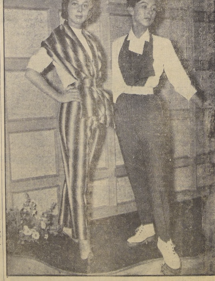
PARIS.— He aquí dos creaciones de André Ledoux, que realizarán la belleza y destacarán la silueta de las jóvenes que son fanáticas por el deporte de la nieve o el esquí. A la izquierda, el modelo "Kanguru", que consiste en un traje de lana con rayas decrecientes; negras y blancas, sobre un pull-over también blanco; a la derecha, el modelo "Chibella", en que el pantalón y el "blastron" son de satén de lana, con finas rayas de tonalidad violeta.