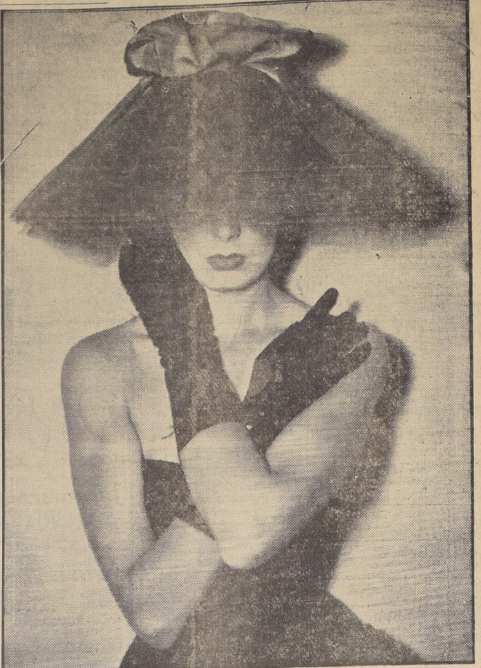
PARIS.— "Plaza Vendôme", se llama este espectacular sombrero de invierno (seguramente estará de moda, junto al Mapocho, en el invierno de 1956), que los críticos han calificado como "el sombrero más original". Es una creación de Rébé, que responde a la consigna del "enlace al servicio de las damas elegantes". Trátase de una gran "cassine de cocktail", en forma de "cloche", confeccionada totalmente en tul plisado.