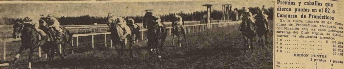
Muy temprano asejó la victoria Martín Fierro en el clásico "Raimundo Valdés Cuevas". Aquí lo vemos cuando termina la milla con tres cuartos de cuerpo sobre Falerno, clasificándose en tercer término Montecarlo y más atrás, Instituto, Vlasov, Paladín, Meléndez y Pistolero. El vencedor fue montado con singular acierto por J. Atala.

OPULENTO CONSIGUE UN NUEVO TRIUNFO. — Contando también con la colización, el potrillo Opulento venció en gran forma en el handicap de dos mil metros que se corrió a continuación. Marqués y Opulento actuaron casi juntos en el primer puesto en los tramos iniciales, destacándose luego Opulento, mientras que Marqués, que iba a la cabeza, se iba desahucando. Los observadores, que se acercaron a la meta, vieron a Opulento, que traía a Marqués, entrando a la recta con amplia ventaja sobre él. Al iniciarse las galerías, Flor de Cardo entró a luchar por el segundo puesto con Marqués, algo abiertos ambos, en tanto If avanzaba por los palos. Sin embargo, ninguno de éstos fue capaz de acercarse siquiera a Opulento, que rápidamente se adelantó, marcando tres largos antes que If; a tres cuartos del cual llegó Marqués; cuarta, Flor de Cardo, a tres cuartos; quinto, Prodigioso, a uno y medio; sexto, Broquiolo, y séptimo y último Buda.