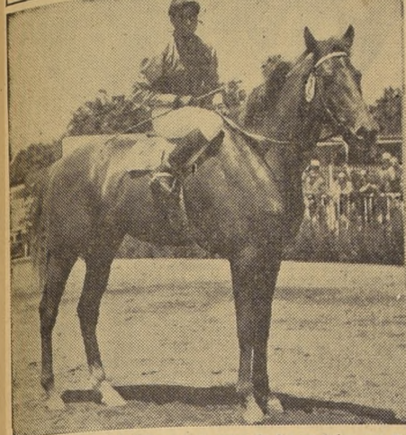
CON 55 KILOS.— Latido, que a pesar de las ventajas que dispensa a sus bravos rivales, destaca una de las mejores chances en la prueba central del Club Hípico.

La Carrera Especial "Luis Dávila Larrain" handicap de mil metros, es el número más importante de la próxima reunión en el Club Hípico. Reunión a nueve veloces elementos, casi todos los cuales aspiran con legítimas posibilidades al primer premio de $ 200.000.