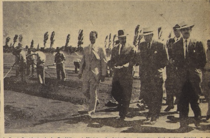
S. E. el Presidente de la República, el Ministro de Agricultura, ingeniero José Suárez Fanjul, y funcionarios del Plan de Desarrollo Agrícola e Higiene Rural de la provincia de Suble, visitando el Vivero Forestal y Estación de Genética Experimental de Chillán