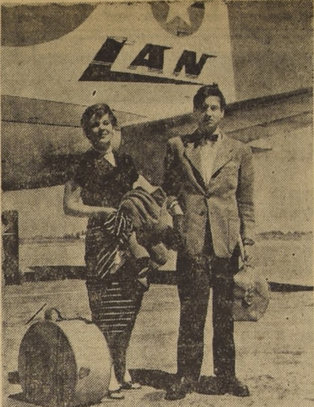
ARTISTAS CHILENOS QUE REGRESAN. Por la vía aérea internacional LAN...