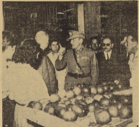
Las visitas que ha efectuado el general Balleiro en compañía del Comité de Control de Precios han tenido bastante efecto. En los negocios céntricos se comprobó no sólo el abuso en los precios, sino también la mala calidad de los artículos comestibles a la venta. Este control estricto en locales céntricos proseguirá con bares y restaurantes, que, bajo el barniz de elegantes y de moda, cobran al cliente precios irrisoriamente altos.

Personeros del comité declararon a nuestro diario que sancionarán sin contemplaciones a aquellos negocios que infringen las leyes y se les sorprenda cobrando facturas más altas que las razonables y justas.