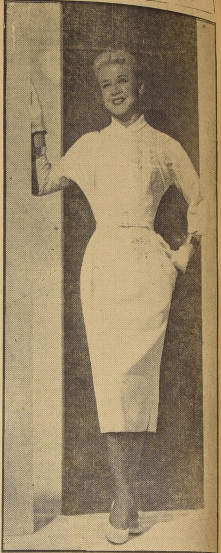
La cimbreante artista Ginger Rogers, de la Paramount Pictures Corporation, aparece en la fotografía, mostrando un modelo exclusivo para su nueva película. Esta blanca tenida raniega ha sido calurosamente recibida por el público femenino.