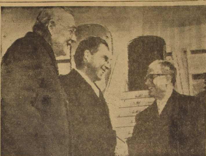
WASHINGTON. — El Presidente de la República de Italia, Giovanni Gronchi, (derecha), recibe el saludo de bienvenida del Vicepresidente de los Estados Unidos, Richard M. Nixon (centro), y del Secretario de Estado, John Foster Dulles, al descender en tierra americana ayer lunes. Gronchi es el primer Jefe de Estado de Italia que visita Estados Unidos.