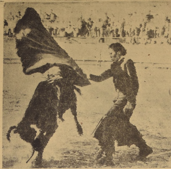
TAMORAS, México.— La torera Patricia McCormick, de Texas, realiza un pase de capa como preliminar del pinchazo que ha de liquidar a la fiera. Patricia entusiasmó a la muchedumbre que llenaba la plaza de toros. Se desempeñó brillantemente y mató dos toros en impecable estilo.