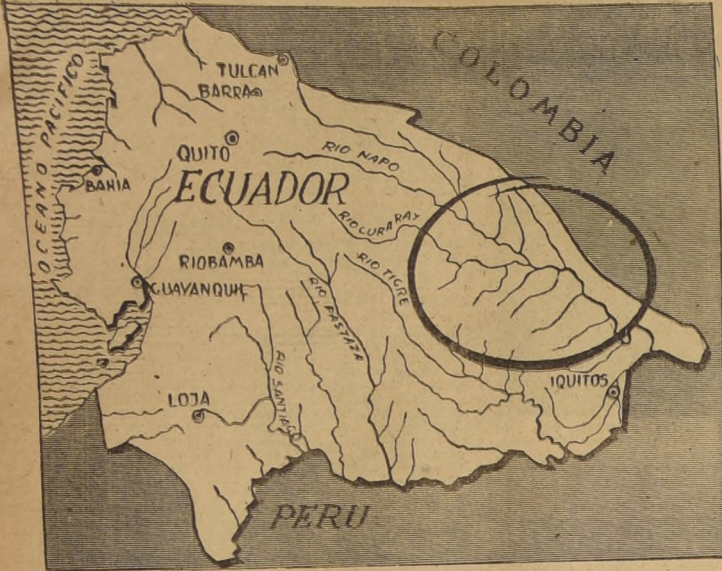
Esta es la inexplorada región de los Aucás, donde el hombre blanco apenas ha puesto el pie. Hace unas cuantas semanas, perecieron en esta zona algunos misioneros protestantes norteamericanos.