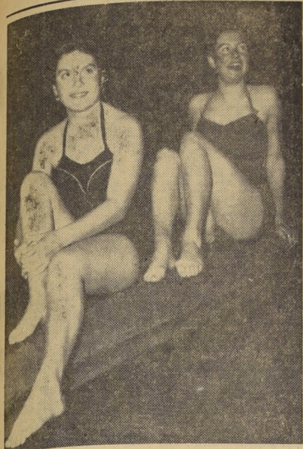
NATACION UNIVERSITARIA. Un éxito más para el tesoro e incansable directorio...