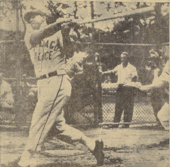
MARCIANO, BEIBOLISTA. El campeón mundial Rocky Marciano, ya retirado del boxeo...