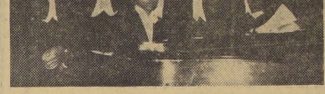
LOS "JUBILEE SINGERS" POR RADIO.

WASHINGTON, 21 (UP). - El dramaturgo Arthur Miller anunció hoy que muy pronto contraerá enlace con Marilyn Monroe.