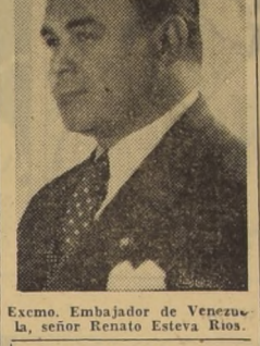
Excmo. Embajador de Venezuela, el señor Renato Esteve Ríos.

MUEBLES FINOS En todos los estilos, enchapados y macizos. Fina terminación, Barniz lavable, precios al alcance de todo presupuesto. GRANDES FACILIDADES VISTENOS SIN COMPROMISO SAN ANTONIO 53 Y 61