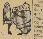
Forman DESVIOS Y DES- VARIOS DEL "RA- DICARTERISMO" público los que los psiquiatras y neurologos de todo el mundo han estado rindiendo al eminente creador del psicoanálisis, Sigmund Freud, con motivo de recordarse el centenario de su nacimiento. También en Santiago se han realizado homenajes parecidos, y la prensa cuenta ayer que los neuropsiquiatras de la capital realizarán algunas sesiones para analizar la obra de gran científico vienés. Nosotros, desde nuestro ángulo de observadores, también queremos sugerir el aprovechamiento de algún material criollo, aunque "nacionalizado", y que podría servir de perlas para ilustrar la obra del gran Freud. Se trata de los densos aunque turbios contenidos oníricos —léase sueños—, del "radiocarterismo", esto es, un "nacimientismo" político que des-gobernó a Chile por unos cuantos lustros, y en que "radiocarterismo" casi la totalidad de los fondos fiscales y semifiscales del país. Ahora bien, ocurre que el "radiocarterismo" no obstante la naturaleza de sus delitos, tanto desde el punto de vista cuantitativo como cualitativo, no siente eso que los psicoanalistas bautizaron con el sugestivo nombre de "sentimiento de culpabilidad". Los "radiocarteristas" son personajes extraños, deformes en el plano mental y tarados en su morfología corporal. Entre ellos se dan con excesiva frecuencia, en forma de pesada carga "heredo-léutica", "obolítica", numerosas anomalías y lesiones irreparables de la corteza cerebral y de otras zonas del sistema nervioso, todo lo cual determina contracciones epilépticas, cleptomanías, reiterada tendencia al delirio, y la aparición súbita de tipos lombrosianos como el "Guataca", "Manos Pochas", el "Mulato de Fuego", "Rodríguez Garibé", y otros "tramos" que fueron los grandes "radiocarteristas" de la "revolución industrial". Pero, volvamos a nuestra oportuna sugerencia a los psicoanalistas y ofrezcamos algunos datos ilustrativos acerca de los sueños que muestran la mente de los "radiocarteristas". Evidentemente, entre los sueños irracionales de estos siniestros personajes sobornados por el "escobar-fuellismo", acaso el más importante, esto es, el "monosueño", a sueño por antonomasia, es el de recuperar la Presidencia de la República. Para cumplir con tan obsesional contenido mental, el "radiocarterismo", a través de sus más connotados gangsters, entre los que destacan, volvemos a repetir, el "Guataca", el "Mulato de Fuego", "Manos Pochas" y "Rodríguez Garibé", en los últimos tiempos ha reiniciado su tradicional juego "a la mala".