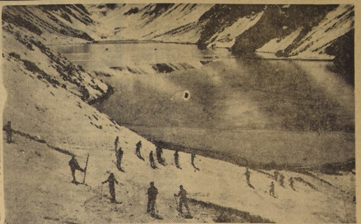
Entre los cordones cordilleranos de los Andes se encuentran las hermosas canchas de Portillo, con la laguna del Inca, que realiza la imponente belleza que dan marco a las jornadas deportivas invernales.