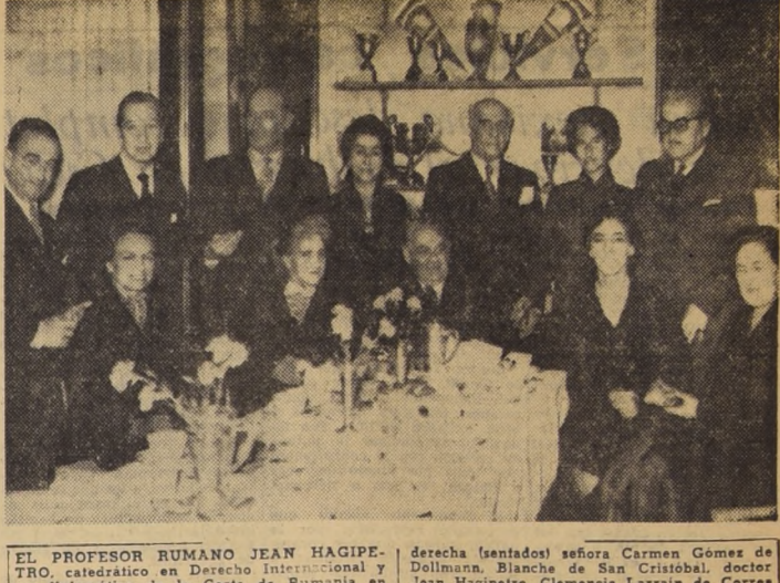
EL PROFESOR RUMANO JEAN HAGIPE- TRO catedrático en Derecho Internacional y ex diplomático de la Corte de Rumania en Roma y otras capitales europeas, quien desde hace algún tiempo se encuentra en nuestro país, ofreció el domingo pasado un pequeño grupo de sus relaciones, que se llevó a efecto en el Hotel Carrera. La fotografía, captada en esa oportunidad, muestra a los invitados en el siguiente orden: de izquierda a