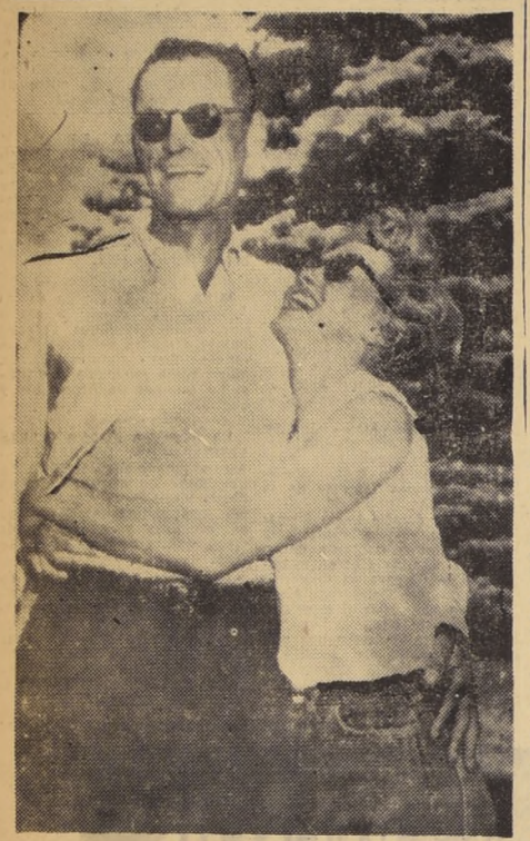
ROXBUEY, Estado de Connecticut.— Aparece en la foto la rubia y popular actriz MARILYN MONROE que abraza efusivamente a su prometido, el dramaturgo ARTHUR MILLER, durante una conferencia de prensa "informal" realizada en la residencia campestre del escritor en las inmediaciones de esta ciudad.

NUEVA YORK.— He aquí a la estrella británica de la pantalla, Dian Dors (— ha sido llamada "la Marilyn Monroe inglesa"). Ayer llegó a Nueva York en viaje a Hollywood, donde espera escalar la celebridad gracias a sus innegables atractivos personales.— (Radiofoto de UNITED PRESS).