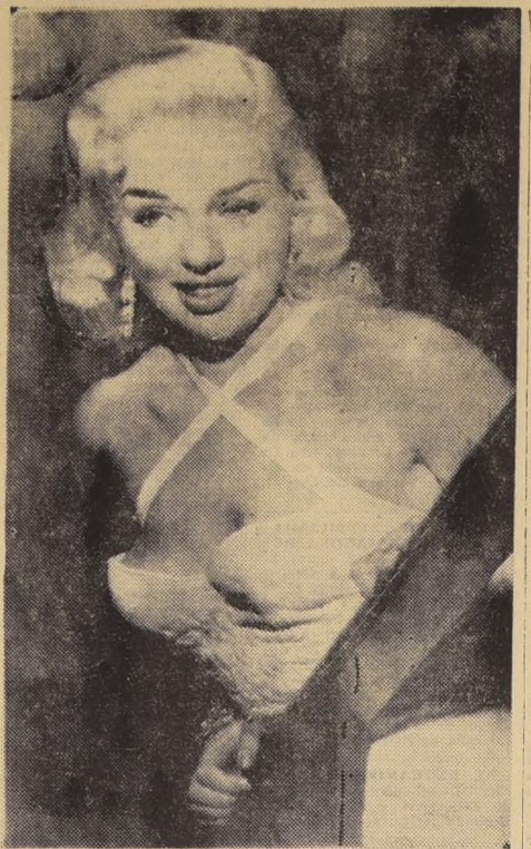
NUEVA YORK.— He aquí a la estrella británica de la pantalla, Dian Dors (— ha sido llamada "la Marilyn Monroe inglesa"). Ayer llegó a Nueva York en viaje a Hollywood, donde espera escalar la celebridad gracias a sus innegables atractivos personales.— (Radiofoto de UNITED PRESS).