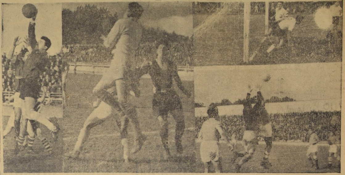
El avance del fútbol, en provincias, en ciudades de mar y sur. La Serena y Concepción son buena prueba de ello. En la metrópoli sura se juega el Torneo Regional, que es el más importante del país, después del de Primera División y el de Ascenso. Aquí presentamos dos aspectos de uno de los encuentros de la jornada más reciente.