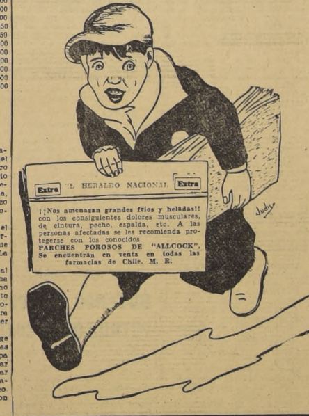
¡Nos amenazan grandes fríos y heladas! con los consignados dolores musculares, de cintura, pecho, espalda, etc. A las personas afectadas se les recomienda protegerse con los conocidos PARCHES PORNOSOS DE "ALLCOCK".

Maui Mau, que en las ventas del año pasado dió la nota sensacional al ser adjudicado en más de 4 millones de pesos, no dió los resultados que se esperaba en razón de sus espléndidos antecedentes.