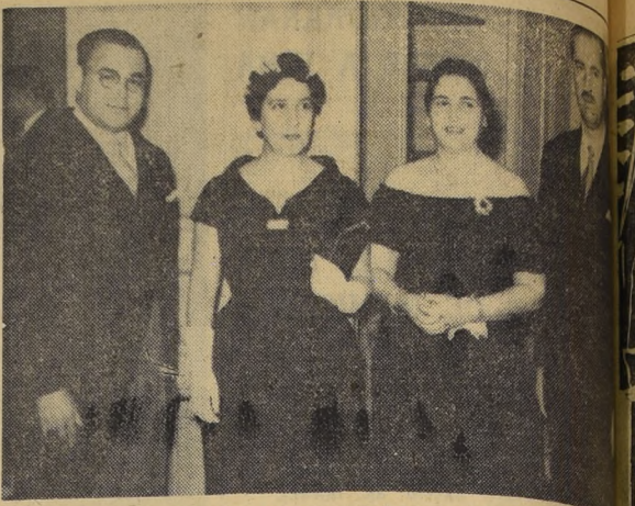
Con motivo del 145º aniversario de la Declaración de la Independencia de Venezuela, se efectuó en la sede de la Embajada de ese país, una recepción que alcanzó relevantes caracteres...