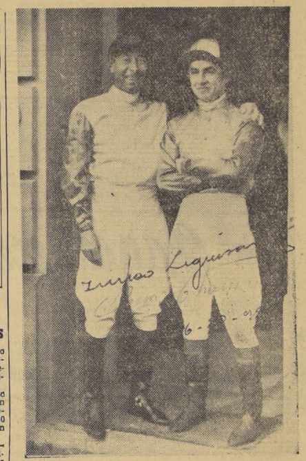
LEQUISAMO, fue uno de los factores que calmó las iras del público argentino. El maestro uruguayo, siempre ha sentido especial simpatía hacia los nuestros, y esta foto es buena prueba de ello.