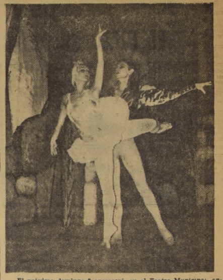
El próximo domingo 8 aparecerá, en el Teatro Municipal, ante el público, iniciando la temporada del presente año, el Ballet Clásico Nacional "Sulima". Con la taquilla llena y a pedido del numeroso público amante de este bello arte, repondrán en escena el Lago de los Cisnes y Baile de Graduados, obras éstas que han alcanzado gran éxito en anteriores temporadas.