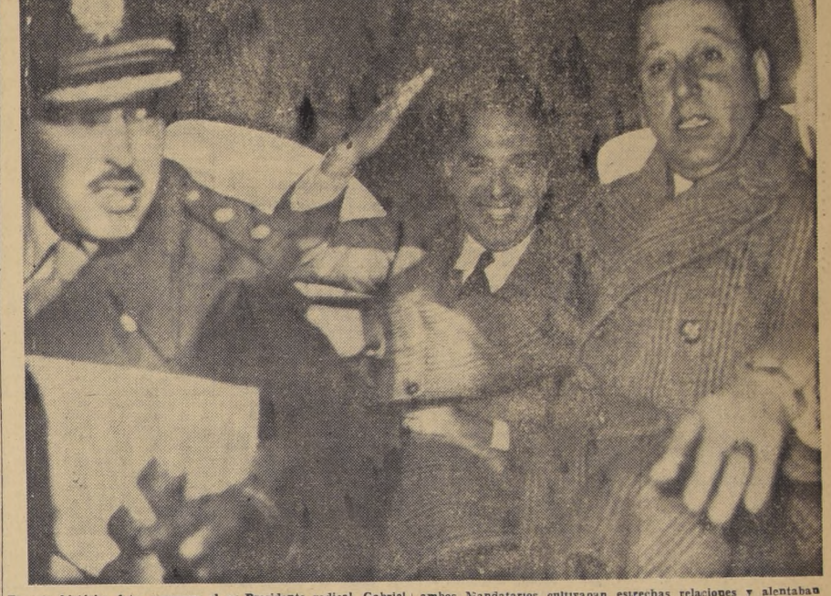
En esta histórica foto, aparecen el ex Presidente radical, Gabriel González Videla, y el ex Presidente argentino, creador del Justicialismo, Juan D. Perón, hace pocos años, en circunstancias que ambos Mandatarios cultivaron estrechas relaciones y alentaban comunes ideales. Obras posteriores a esta cordial reunión, son un proyecto de tratado económico y la creación de un diario.