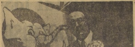
John Foster Dulles, secretario de Estado, con Eisenhower y el secretario de prensa de la Presidencia, James C. Hagerty.

En las últimas horas de la tarde se hará una autopsia al cadáver y se tratará de identificarlo. El cuerpo encontrado es de un hombre de unos 175 libras de peso, y de 1,76 metros de estatura. Galíndez había sido descrito como hombre delgado, de unos 160 libras de peso y 1,60 de estatura.