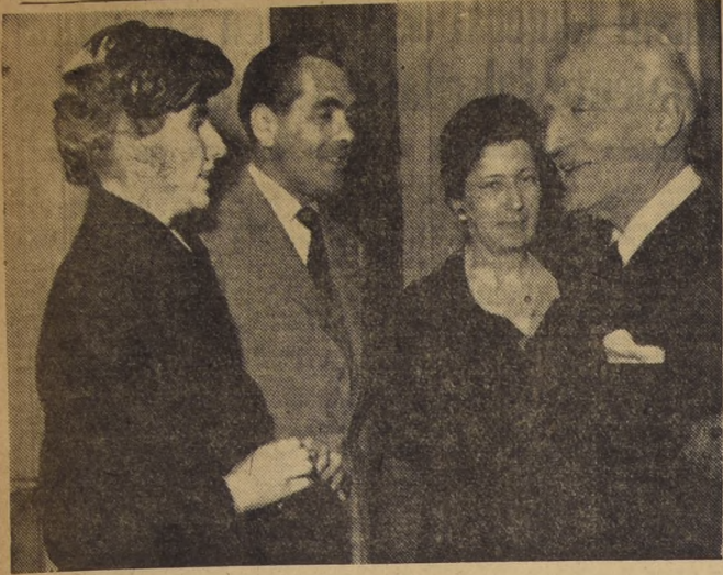
EN LOS SALONES DE LA SOCIEDAD NACIONAL DE AGRICULTURA se llevó a efecto el cóctel con que el Club de Jardines de Chile festejó a su presidenta...