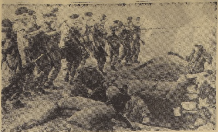
EL CAP. EGIPTO.— Un destacamento de "Tomies" británicos se despidió con el tradicional saludo de "pulgares arriba", luego de haber hecho entrega de sus posiciones de primera línea a tropas danesas de la Fuerza de Emergencia de la NU. Gran Bretaña y Francia anunciaron ayer su intención de retirarse "esta mañana", pero no antes de que se hayan estipulado todos los detalles con los dirigentes de las Naciones Unidas.

El anuncio oficial de esta nueva consecuencia de la intervención británica en Egipto coincidió con otra etapa de las negociaciones de oro y divisas, que en noviembre concluyeron en 25 millones de dólares, la baja mayor desde 1952. Macmillan anunció que de cualquier modo el Gobierno está dispuesto a mantener el valor de la libra en su cotización actual de 2.80 dólares.