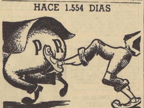
HACE 1.554 DIAS EL PUEBLO LOS ARROJO DEL PODER Y NO VOLVERAN

Un pronunciamiento de su Comisión de Relaciones Exteriores, el Senado ocupará hoy del proyecto de acuerdo que aprueba el Convenio de Meteorología Mundial.