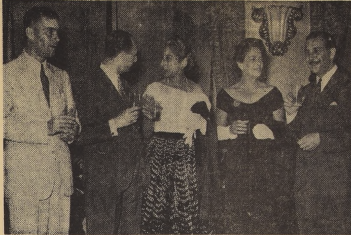
COCTEL DE AEROLINEAS ARGENTINAS. En el Hotel Grillon fue captado este grupo de asistentes al coctel que ofreció la empresa de aeronavegación...