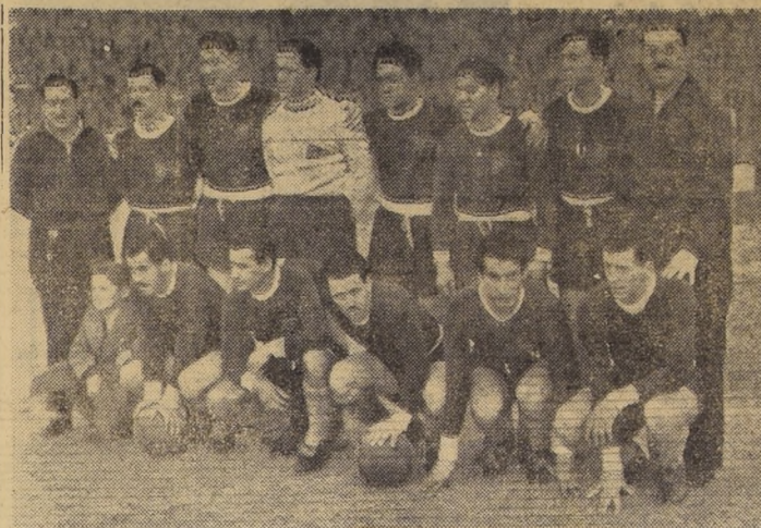
LOS "GRANATES". — Esta es el cuadro superior de Lanús de los participantes en la temporada que patrocinó Colo Colo...