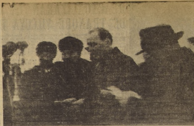
BUDAPEST.— El Primer Ministro de China Comunista, Chou En-Lai (segundo de la izquierda), escucha un discurso de bienvenida que pronuncia su colega húngaro, Janos Kadar (a la izquierda) el 16 del presente. Chou dijo que era portador de credenciales de Polonia "independiente" para Kadar.

CONSPIRACION IMPERIALISTA.— Chou y Bulganin aprovecharon la oportunidad para condenar la rebelión anti-comunista de Hungría con una "conspiración imperialista" y al mismo tiempo denunciaron la doctrina Eisenhower para Medio Oriente como una continuación de la guerra en frío, encaminada a aumentar la tensión.