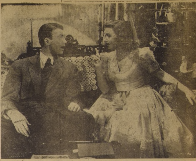
QUE BELLO ES VIVIR! - Ese es el nombre de la cinta en que James Stewart, el actor que viene a Chile...