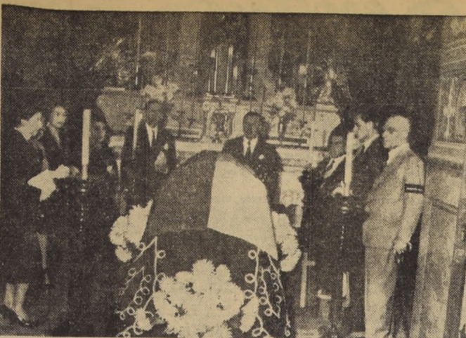
CHILENOS HACEN CELEBRAR MISAS POR GABRIELA MISTRAL EN S. PAULO — El Círculo Chileno de Sao Paulo, entidad que reúne a los chilenos residentes en dicha ciudad brasileña, promovió una misa de requiem por Gabriela Mistral en la Iglesia Santa Efigenia. Comparecieron altas autoridades, escritores, artistas y admiradores de la poeta. En el grabado, grupo de asistentes rodea el catafalco simbólico cubierto por la bandera chilena. La misa fue televisada por las cámaras de la TV Tupi Canal 3.

También será necesario renovar el acuerdo sobre intercambio de frutas ya que el actual vence el 31 de marzo. Se eleva a 40.000.000 de dólares el valor de este intercambio, que forma el renglón más importante del comercio entre los dos países, después del trigo y el café.