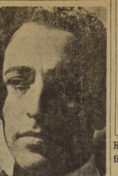
HUGO DEL CARRIL, el artista argentino de fama internacional, de "Más allá del olvido", le ha significado ya un éxito sin precedentes en todas las ciudades donde el film ha sido estrenado.

ARTIFICE DE SU DESTINO - El nuevo estilo de Hugo del Carril en "Más allá del olvido", le ha significado ya un éxito sin precedentes en todas las ciudades donde el film ha sido estrenado.