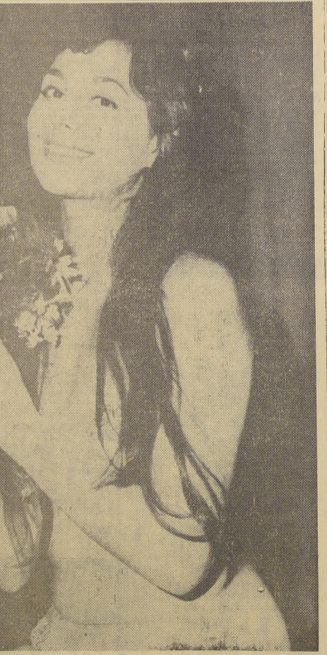
ELECCION DE "MISS FRANCE" EN LYON. — Hace unas noches, en el Palacio de Invierno de Lyon se llevó a efecto la elección de "Miss France"...

LA LUZ más perfecta creada por el hombre es eficiente en sólo 2%, pues el 98% restante se pierde en calor.