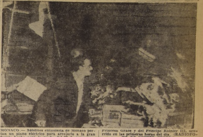
MONACO. — Súbditos entusiasta de Mónaco portan un plano eléctrico para arrojarlo a la gran fogata hecha aquí, la noche del 23 de enero, para celebrar el nacimiento de la heredera de la Princesa Grace y del Príncipe Rainier III, ocurrido en las primeras horas del día.

La nueva empresa se propone iniciar sus operaciones en los primeros días de marzo próximo. Los vuelos unirán Lima con Arica, Santiago y Buenos Aires, por el sur; y, por el norte, con Guayaquil, Barranquilla, Panamá y La Habana.