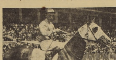
NOGARO, el rápido hijo de Nars-ed-Din, después de su última victoria en el Club...

TERCERA CARRERA.- 1.400 metros.- 1.0 BONANZA, 52 kilos; O. Meneses. 2.0 Pezanos, 50.