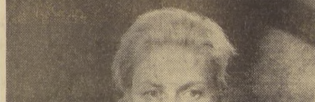
La notable actriz, en el papel de Anastasia, cuya magistral actuación le valió el premio que anualmente otorgan los críticos de Nueva York.

LOS CRITICOS DE NUEVA YORK PREMIAN A INGRID BERGMAN POR SU ACTUACION EN "ANASTASIA, LA PRINCESA VAGABUNDA"