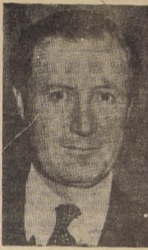
DUNCAN SANDYS. — Parte hoy a EE. UU. para tratar nuevas bases para la participación de Gran Bretaña en la defensa de Occidente.

Continuando su anuncio sobre reducción de gastos y efectivos de las Fuerzas Armadas y reorganización de las mismas de conformidad con ello, MacMillan dijo en los Comunes: