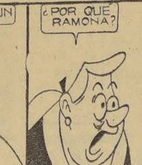
¿POR QUÉ RAMONA? ¿PORQUE EL SEÑOR NO TOMA MAS QUE VINO?