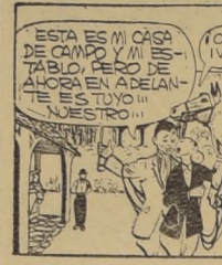
ESTA ES MI CASA DE CAMPO Y MI ESPOSA. TABLO, PERO DE AHORA EN ADELANTE ES TUO Y TU MESTRO.