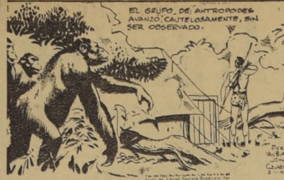
EL GRUPO DE ANTROPOMORFOS AVANZA CAUTELOSAMENTE, SIN SER OBSERVADO.