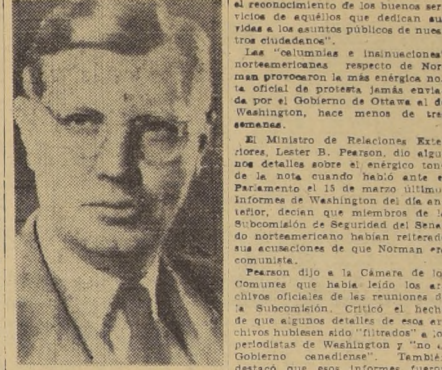
El Embajador de Canadá en El Cairo, Egerton Norman, que se suicidó ayer en la capital egipcia.

BOGOTA, 4 (UP).— El Embajador de Chile en Colombia, Celso Vargas, culpó a la extrema izquierda de los incidentes en su patria, a tiempo que los periódicos los comentaban en sus páginas editoriales.