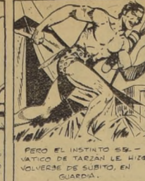
PERO EL INSTINTO SE VATICÓ DE TARZAN LE HIZO VOLVERSE DE SUBITO, EN GUARDIA.