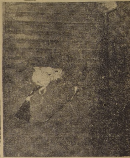
Un paquete con ropa robada queda en el suelo, luego que un grupo de diez ladrones, que fueron sorprendidos por fuerzas del Ejército cuando saqueaban la tienda "Claring", en Estado 348, huyó rápidamente. El bulto está formado por ropa interior de nylon, envuelta en un abrigo de fino paño, totalmente nuevo. Un soldado vigila la propiedad privada, luego de haber usado su carabina contra los ladrones.