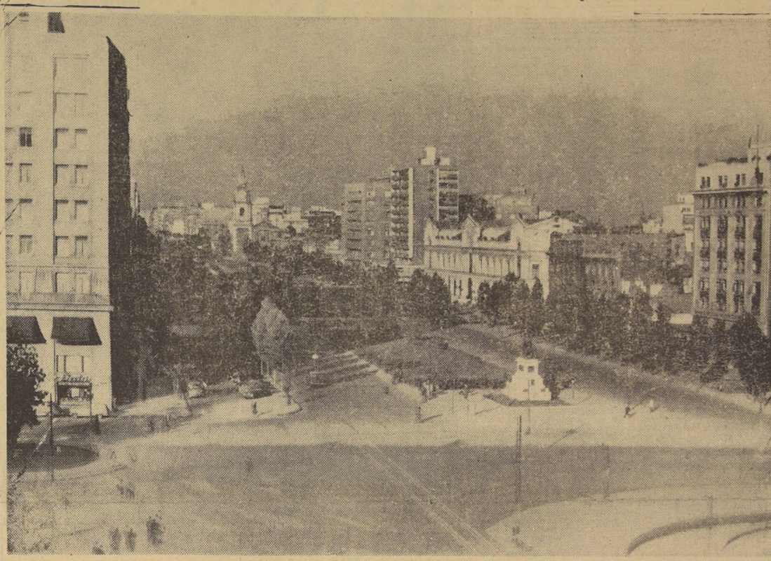
Santiago vivió ayer un día relativamente tranquilo. Al anochecer, pero fueron rápidamente dominados. Ayer, la tensión había aflojado y la ciudad estaba custodiada por fuerzas del Ejército y Carabineros. El miércoles fue un día de tensión y algunos focos aislados estallaron al oscurecer, pero fueron rápidamente dominados. El sábado muestra un aspecto de relativa tranquilidad, quedando sólo por olas de rumores. El sábado muestra un aspecto de relativa tranquilidad, quedando sólo por olas de rumores. El sábado muestra un aspecto de relativa tranquilidad, quedando sólo por olas de rumores.