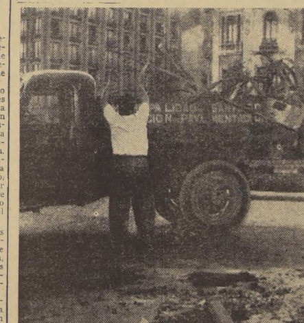
En la centralísima esquina de Ahumada con Alameda Bernardo O'Higgins, camiones de la Dirección de Pavimentación de la Municipalidad de Santiago proceden a recoger los retorcidos fierros de las defensas de los jardines, que los árboles del sector, rocas de canchales que servían para regar las áreas verdes, y las cajas del sistema automático de semáforos. En primer plano, el grabado permite apreciar como la acción de las turbas desatadas llegó hasta dañar el pavimento.