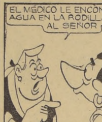
EL MEDICO LE ENCONTRÓ AGUA EN LA RODILLA AL SEÑOR.