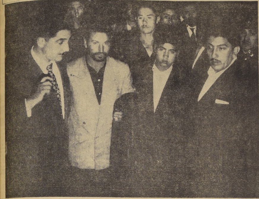
Dos funcionarios de Investigaciones flanquean, en el primer plano del grabado, a varios detenidos —extraños ejemplares de estudiantes—, durante los saqueos al comercio de la noche del mar-