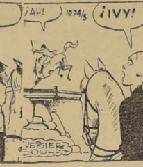
¿POR QUÉ RAMONA? ¿PORQUE EL SEÑOR NO TOMA MAS QUE VINO?