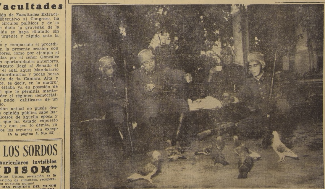
Cuando soldados del Regimiento Tacna, destacados en la Plaza de Armas, comparten sus once con las palomas que, en estos días, han sido alimentadas por las Fuerzas del Ejército. Al desaparecer el público que tradicionalmente concurre a nuestro principal pasaje de la capital. Son fuerzas de paz y no de guerra, las que así saben amenizar el cumplimiento del deber con la nota amena de la vida diaria.