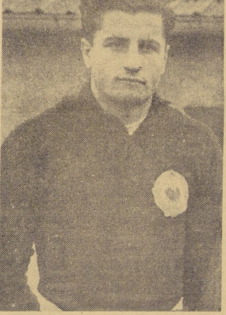
LA "PANTERA YUGOSLAVA". — Beara, arquero de Estrella Roja...