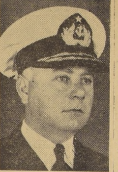
Contralmirante Manuel Quintana, Ministro de Educación.