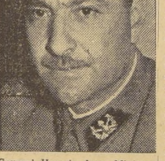
General Horacio Arce, Ministro de Economía.