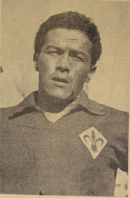
CON LA FLOR DE LYS. — Miguel Angel Montuori, crack de Fiorentina...