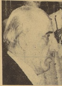
Ibrahim Hashem, que fue designado Primer Ministro de Jordania, en la madrugada de ayer.

Por su parte, la policía de Camaguey apresó a once miembros del movimiento clandestino 25 de julio. El anuncio policial dice que la edad de los detenidos oscila entre los 18 y los 28 años. Los acusados de complotar un ataque al cuartel del regimiento Agrarista, en fecha no determinada, pero que consistiría con acciones similares contra la guarnición de las villas, en la provincia de Santa Clara. Dijo que uno de los presos declaró que se disponía de 600 hombres para los ataques coordinados. El procedimiento de Camaguey fue precedido por la explosión de cuatro bombas en las primeras horas de la mañana.