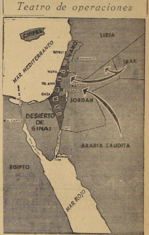
Las flechas señalan en el mapa el avance de las tropas de Irak y de Arabia Saudita que ayer tomaron posiciones en territorio jordano, con el fin de proteger al Gobierno del Rey Hussein, a quien pretenden derrocar elementos izquierdistas y contra cualquier acción que pudieran emprender las tropas de Siria.