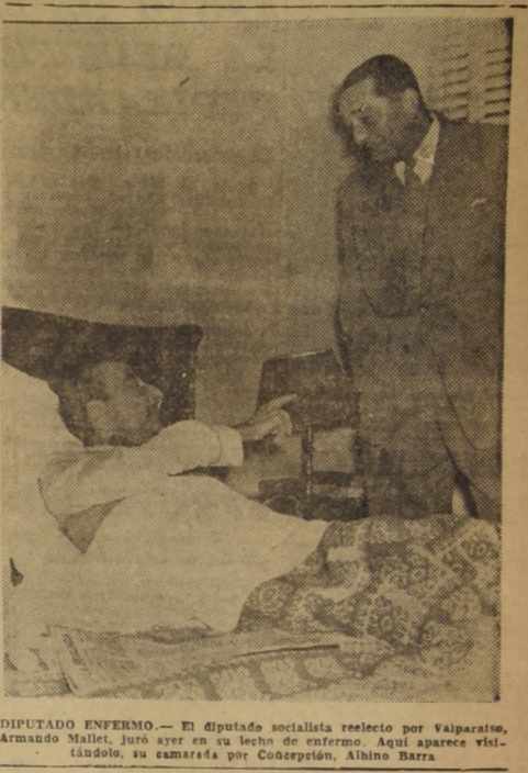
DIPUTADO ENFERMO - El diputado socialista reelecto por Valparaíso...