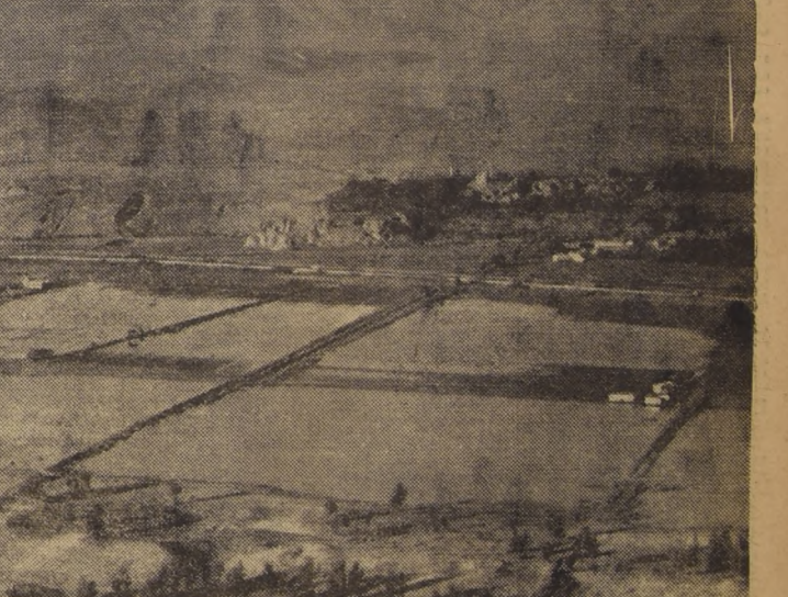
Las copiosas lluvias caídas en la hoya hidrográfica del río Elqui aumentaron considerablemente su caudal y causaron inundaciones en extensas superficies de tierras bajas que rodean a la ciudad de La Serena. En el grabado, las vegas del lado norte, que el esfuerzo de algunos colonos extranjeros habían convertido en predios laborables y que los desbordes han transformado ahora en verdaderas lagunas, cuyas aguas arrastran la delgada capa vegetal tan dificultosamente acumulada, provocando la ruina de sus propietarios.— (Foto O. Molina, por gentileza LAN - CHILE).

TERMINO DE LAS BONIFICACIONES. — En lo que se refiere al término del sistema de bonificaciones para determinados artículos (de azúcar, yerba mate) el señor Ciudad dijo que no se puede continuar con las bonificaciones sobre algunos productos, debido a que el Fisco no tiene recursos en moneda corriente; ni tampoco se puede recurrir al sistema de nuevas emisiones, lo cual es contrario al plan antiflacionario. Luego, el Ministro de Hacienda informó al Consejo sobre el déficit presupuestario de 1957, debido a la baja del precio del