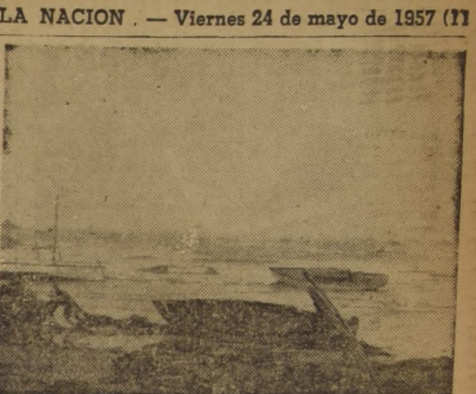
QUINTERO — Las playas de este puerto quedaron convertidas en cenizas a raíz del violento temporal que azotó la costa. Los daños se calculan en muchos millones de pesos, y el movimiento en la bahía demorará en normalizarse, mientras se reparan dichas embarcaciones. — (TAGLE, corresponsal)

ANGOL — El punto Olivo, en el camino de Renico a Angol, fué totalmente arrasado por el temporal. Su reposición demandará un gasto de dos millones quinientos mil pesos.