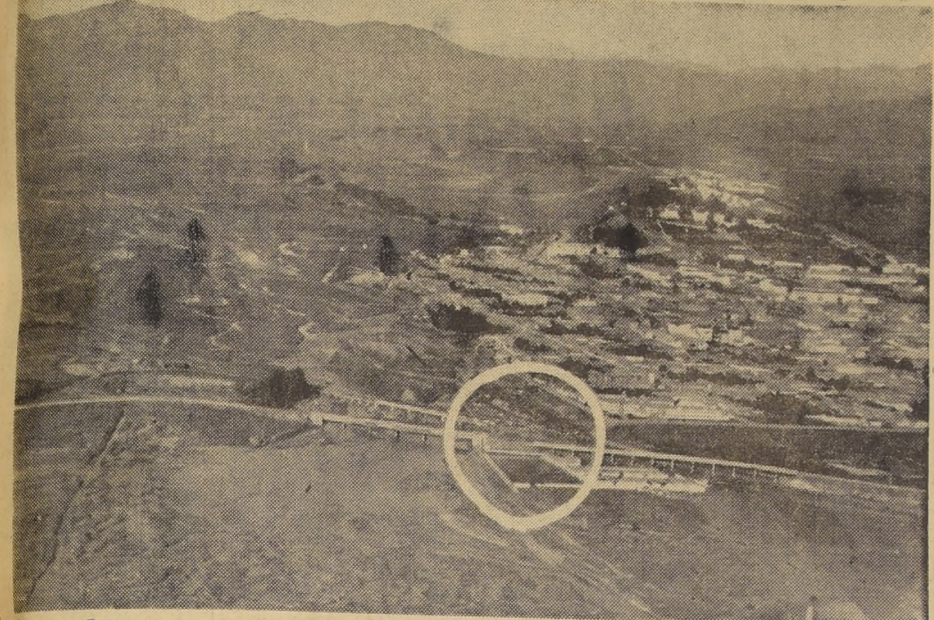
La Carretera Panamericana, a la salida norte de la ciudad de La Serena, cruza el río Elqui por un moderno puente de concreto armado, que las aguas cortaron en un tramo considerable, como puede verse dentro del círculo de esta fotografía, que muestra el desolador panorama que ofrece esta parte de la capital de Coquimbo.— (Foto O. Molina, gentileza LAN - CHILE).

Puentes destruidos, casas derrumbadas y campamentos aislados