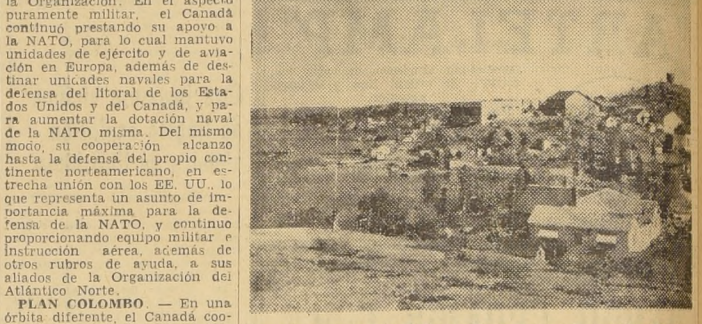
La antigua ciudad de Yellowknife se encuentra enclavada sobre un promontorio rocoso, a orillas del Gran Lago del Esclavo, a sólo 450 kilómetros del Círculo Polar Ártico...