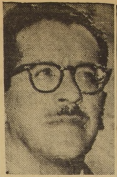
HERNAN SILES ZUAZO, Presidente de Bolivia, que logró hacer fracasar la huelga general de obreros que debía empezar hoy.