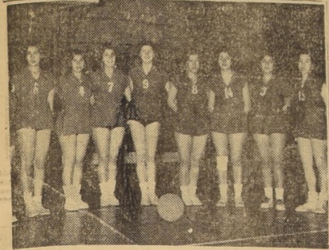
Fama, que ayer se impuso estrechamente a Madema, por 28 a 25 BASQUET FEMENINO.