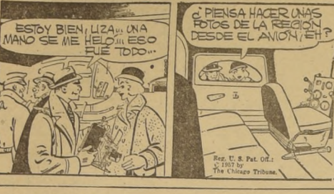
¿PIENSA HACER UNAS FOTOS DE LA REGION DESDE EL ANON? SI LA CASA ADONDE VOS ESTABA PARCEJA UN GRANERO, PERO VO NO LA VI POR FUERA