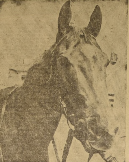
El Club Hípico de Chile...

Buenos rivales tendrá la carrera especial del Chile 'Jhone Pizarro'