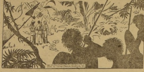
LOS AGRESORES ESTAN TARZAN Y SUS AMIGOS QUE NO OBSERVAN LA PRESENCIA DE SU GRUPO