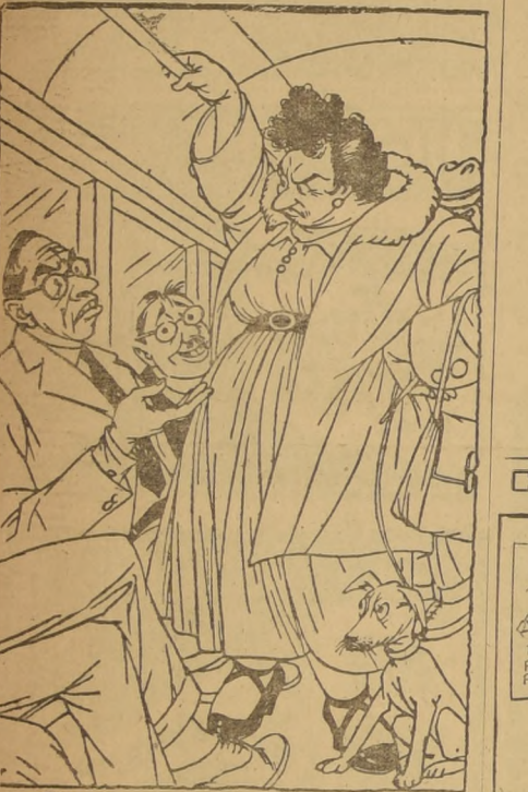
— Parece que ya se acabaron los caballeros! — No, lo que se han acabado son los asientos.

"HISTORIA DEL PACIFICO", por H. W. Van Loon, edición Eretila, ilustrada, 321 páginas; Santiago, Chile, 1935.