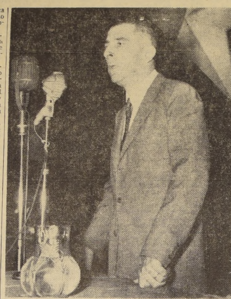
Eduardo Frei, candidato a la Presidencia de la República

clama una actividad económica orgánicamente orientada, no una actividad económica burocráticamente dirigida. La desorganización del trabajo nacional, derivada de la estructura monopolista de las empresas y de los inadecuados organismos gremiales.