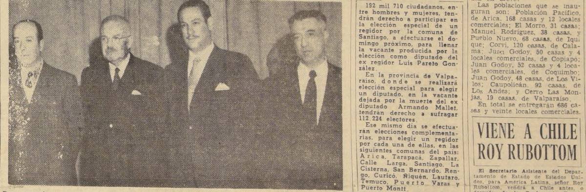
Poco después de prestar juramento, los nuevos Ministros de Salud, Dr. Jorge Torreblanca, y de Tierras, don Enrique Méndez Carrasco, se les ve en el grabado en compañía del Presidente de la República, Excmo. señor Ibáñez y del Ministro Secretario General de Gobierno, don Mario Ciudad Vázquez.