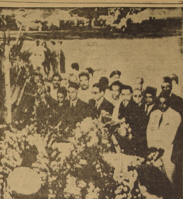
EL CAIRO. — El atadú del Agha Khan, jefe de más de diez millones de musulmanes ismaelitas, llegó a esta ciudad por vía aérea, provocando un gran movimiento espiritual entre los creyentes de la secta.