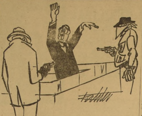
"Le ruego esperar un segundito, señor, pero creo que este caballero llegó primero".