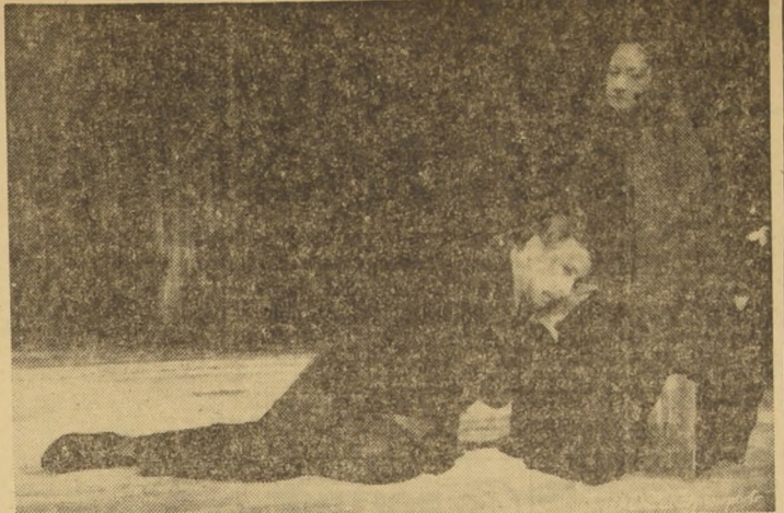
VERSION DE OBRA DE D'ANNUNZIO. - "La fiaccola sotto il moggio", que nos dará a conocer hoy la compañía italiana de comedias en el Municipal...