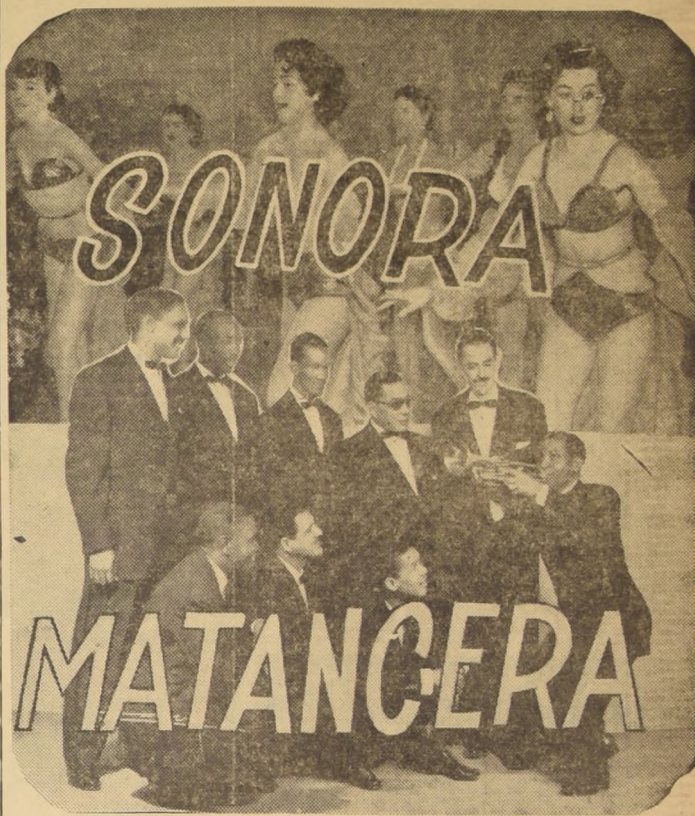
Justificado entusiasmo en todos los circulos capitalinos por las "Noches Cubanas" del elegante Tap Room, que esta noche se inician con la mundialmente famosa Orquesta Habanera "Sonora Matancera"...