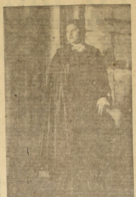
CLAUDIA PARADA, la eminente soprano chilena, consagrada en el Escudo de Milán, como una de las más notables cantantes de su época de nuestros tiempos, que reaparecerá mañana en el Municipal, encarnando el papel de "Tosca", en la ópera del mismo nombre del maestro Puccini.

Claudia Parada, la eminente artista lírica chilena, consagrada en los centros líricos del mundo como la más grande artista de su generación de nuestros tiempos, reaparecerá mañana en la noche en el Municipal, encarnando el papel de "Tosca" de la célebre página de Puccini.