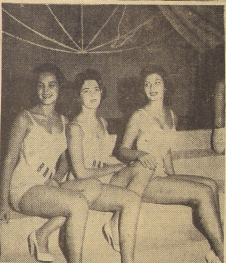
LAS TRES PRIMERAS. — He aquí las tres muchachas más bellas del mundo. En primer lugar aparecen Miss Brasil, que ocupó el segundo lugar; en el medio, “Miss Washington”, que ocupó el tercer lugar; y finalmente, “Miss Perú”, que fue distinguida como “Miss Universo”, la joven más hermosa del mundo.