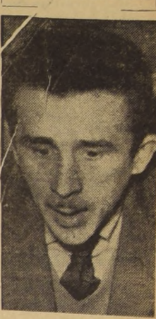
Zoltan Szankay, universitario húngaro, quien tuvo actuación destacada en la rebelión popular de Budapest contra la dominación soviética.