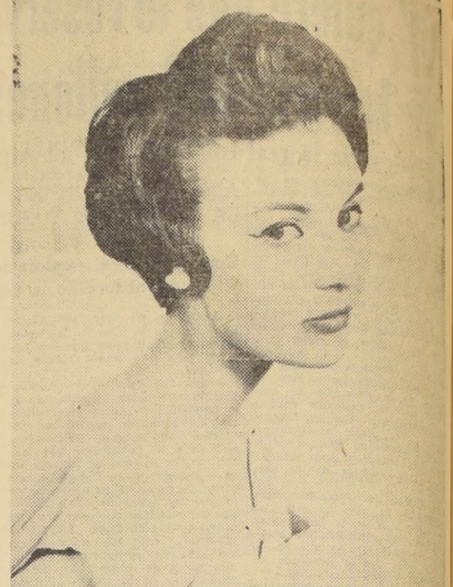
"Capricieuse" se llama este peinado de M. Simonneau del Sindicato de la "Haute Coiffure Française". Creación Liana "Belle Amie" para la primavera 1957.