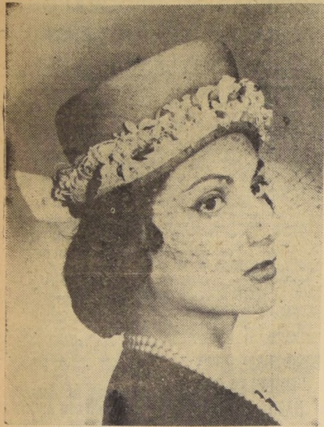
"Diane", toca de pajita Bakou, color canela, adornada de una guirnalda de flores anudada atrás por un sgrain beige claro. — (Modelo de "Maud", París.)