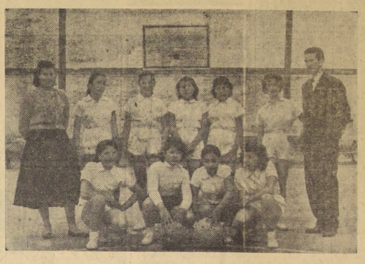
SELECCION ESCOLAR DE LINARES - Equipo representativo de la ciudad, que participará en el Campeonato Nacional de Fútbol Amateur...