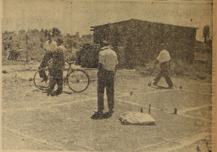
La autoconstrucción es la solución que los chilenos de trabajo han encontrado al problema de la vivienda. Después de abandonar las faenas que le dan el sustento, los obreros levantan sus habitaciones. Primero, se hace el trazado, como puede verse en el grabado, y luego, ladrillo a ladrillo, se levanta la casa.

tualmente se efectúa la venta por pisos. La empresa constructora, que tuvo a su cargo la construcción, fue la de Emilio Peregrini, habiendo participado además, las siguientes firmas técnicas del ramo: los vidrios y cristales fueron provistos por Esteban Dell'Orto. Los artefactos sanitarios los suministró la firma Escobar e Hijo. Los ladrillos de Fábrica Renca. Instalaciones eléctricas efectuadas por Flischan y Cia. Maderas elaboradas de Barraca Kleinkopf. Los proveedores de materiales eléctricos fueron Rhein y Cia. Pinturas de colores, Ferrier. Puertas de fierro de Mina Hnos., etc.