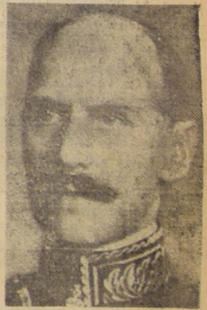
HAAKON VII, Rey de Noruega, quien falleció en la madrugada de hoy.