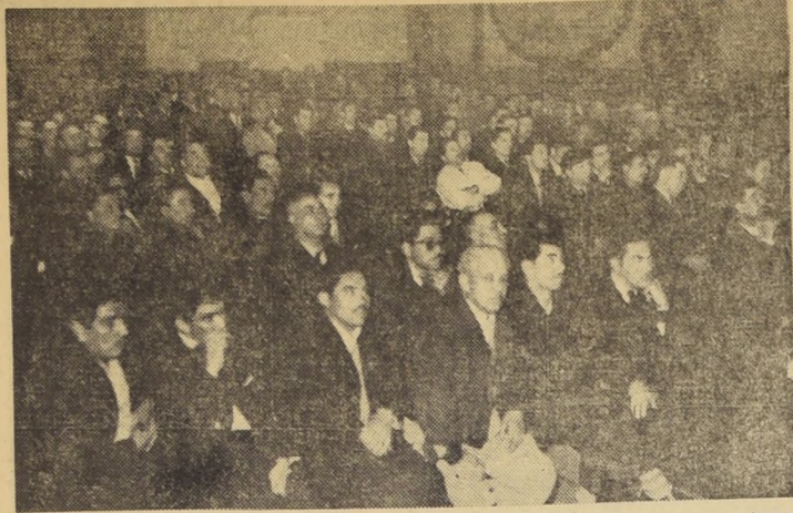
ASAMBLEA DE COMANDO GREMIALISTA DE ETCE.- El Comando Gremialista de la Empresa de Transportes Colectivos del Estado...