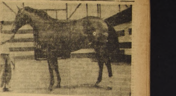
GALATERA, por Buñón y Morera, propia hermana de Limelight, tiene muchos interesados en la subasta de hoy del Haras Casablanca. Es una preciosa hembra de seguro porvenir.