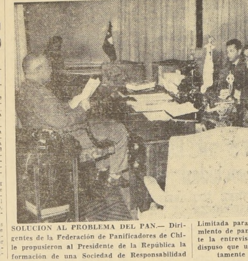
SOLUCION AL PROBLEMA DEL PAN.- Dirigido por la Federación de Panificadores de Chile...