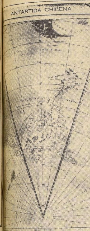
Este mapa muestra los límites exactos de la Antártida que ayer fueron desconocidos por un matutino santiaguino. Este mapa nos fue proporcionado por la Dirección del I. Geográfico y el corresponde a la edición realizada por este organismo.

22 metros de largo tiene el cohete propulsor de 3 etapas