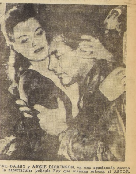
GENE BARRY Y ANGIE DICKINSON, en una apasionada escena de la espectacular película Fox que mañana estrena el ASTOR.