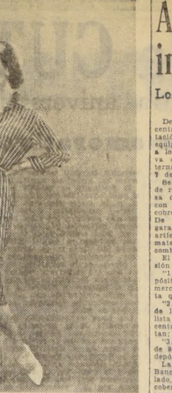
Elegante y fresca es esta bata, ideal para el verano, en color azul real, con listras blancas, es un modelo de Susan Small.

PHILIPS DISCOS PHILIPS presentan: BEETHOVEN SONATAS PARA PIANO CLAUDE DE LUXE HARRI WILSTEIN FATICA - Appassionata Al piano: HANS RICHTER-HAASER Todos los discos PHILIPS son de ALTA FIDELIDAD