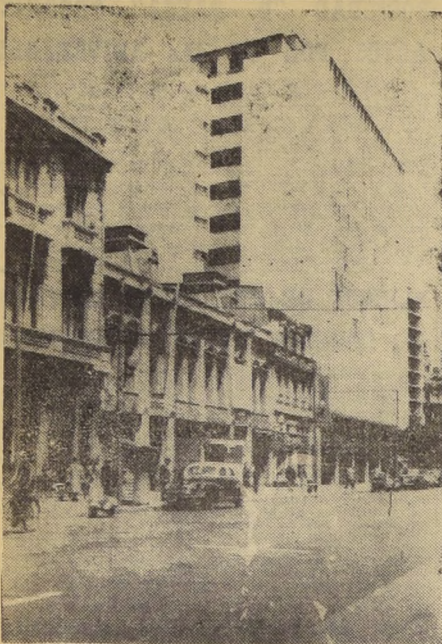
AVDA. PEDRO MONTT, DE VALPARAISO SERA ESCENARIO DEL GRAN FESTIVAL DE VERANO. La amplia y hermosa Avenida Pedro Montt, de Valparaiso, una de las más anchas de Chile, se transformará desde el 20 del presente mes en el escenario del Gran Festival de Verano...