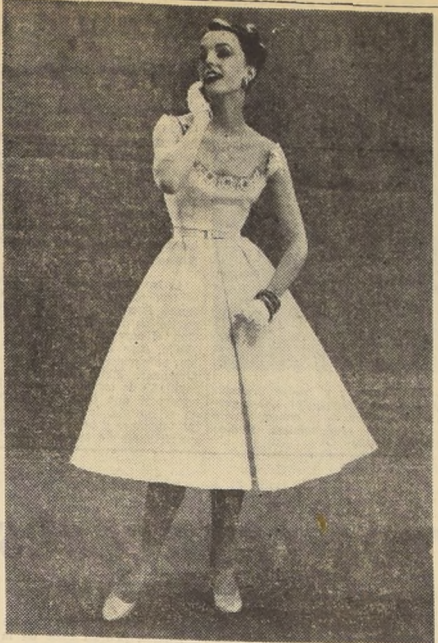
Este traje de verano, en piqué Marcela, según modelo de Susan Small...