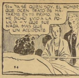
TARZAN - 5139