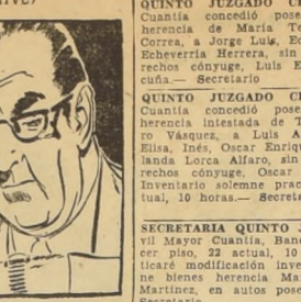
Por Sam Leff