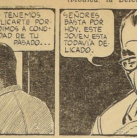
Por Chester Gould