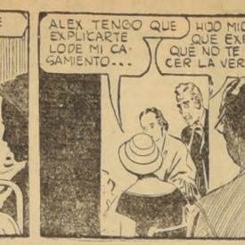
Por Edgard Rice Burroughs