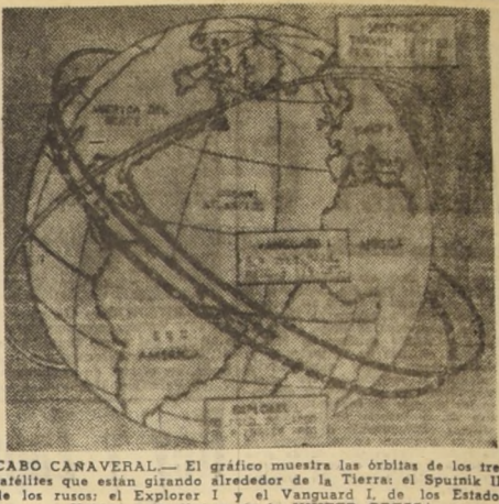
CABO CARAVERAL.— El gráfico muestra las órbitas de los tres satélites que están girando alrededor de la Tierra: el Spunik II, de los rusos; el Explorer I, y el Vanguard I, de los Estados Unidos.