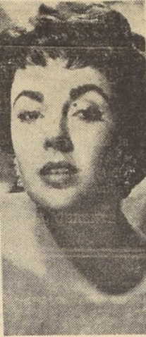
ELIZABETH TAYLOR, que está inconsolable ante la trágica muerte de su esposo Mike Todd, que pereció en un accidente de aviación.