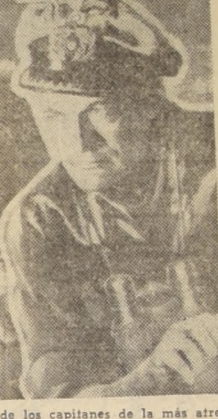
ROBERT MITCHUM, como uno de los capitanes de la más atrevida historia del mar, un film de impresionante realismo.