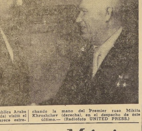
MOSCÚ.— El Presidente de la República Árabe Egipto, Gamal Abdel Nasser (izquierda) visitó el Kremlin, ayer. En el grabado aparece estrechando la mano del Premier ruso Mikita Khrushchev (derecha), en el despacho de éste último.

Los grupos de sedicidos se apoderaron de la estación de radio local y apresaron al Alcalde, a quien anunciaron que había estado en una revolución, exigiéndole que se sumara a ellos. Sin embargo, los agentes de la policía que formaban el destacamento de planta en la localidad se resistieron.