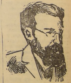
OSCAR NEEBE: "La causa del pueblo, la causa de los trabajadores, no se destruye con la horca".